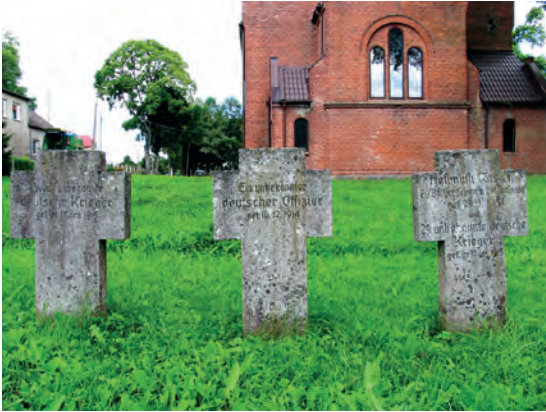
Abb.II.3.3 Deutscher Soldatenfriedhof in Marijampolė

Das Ende des Ersten Weltkrieges brachte die Gründung der Ersten Litauischen Republik. Die junge Republik konnte sich jedoch nicht gegen die territorialen Ansprüche Polens rund um Vilnius wehren, die von polnischen Truppen 1920 im Polnisch-Litauischen Krieg durchgesetzt wurden. Seinerseits annektierte Litauen am 10. Januar 1923 das ostpreussische Memelland mit der Hafenstadt Memel (heute Klaipėda). Am 8. Mai 1924 wurde diese Annexion in der Memelkonvention vom Völkerbund anerkannt. Während der Zeit der ersten Republik gab es einen großen Aufschwung in der litauischen Kultur und Bildung um die Hauptstadt Kaunas.