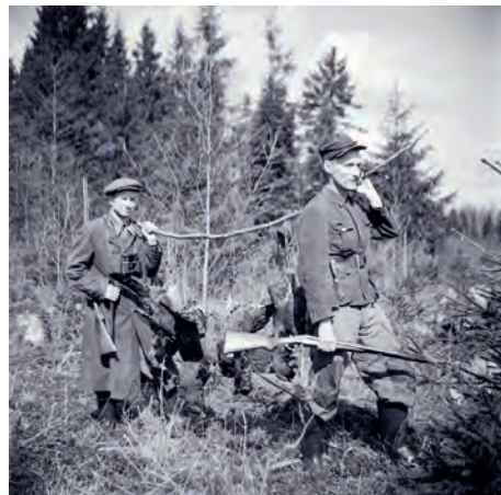
Abb.II.1.5 Estnische Widerstandskämpfer wie die „Waldbrüder“ waren aufgrund sowjetischer Gegenmaßnahmen auf sich gestellt und lebten aus der Natur der Region.

Die bereits 1940 implementierten sowjetischen Unterdrückungsmaßnahmen gegen die estnische Bevölkerung verstärkten sich nach dem Zweiten Weltkrieg. Widerstand gegen die Sowjets leisteten ähnlich wie in den anderen baltischen Staaten die estnischen Waldbrüder. Zur Niederschlagung des Aufstandes wurde vermehrt zu alten Instrumenten der Umsiedlung und Deportation jetzt auch die Ansiedlung von ethnischen Russen betrieben, um so eine durchgreifende Russifizierung in der „Sowjetrepublik Estland“ umzusetzen. Es sind vor allem die in der Nachkriegszeit gemachten Erfahrungen mit den als Besatzer empfundenen Russen, die das Verhältnis des modernen Estland sowohl zum Nachbarland Russland als auch zur russischen Minderheit innerhalb der eigenen Gesellschaft bis heute nachhaltig prägen.