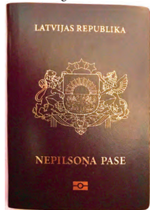
Abb.II.2.7 Lettischer Nichtbürger-Pass

Die Schaffung des Sonderstatus ist als späte Reaktion auf die erzwungene Russifizierung während der Sowjetunion zu erklären. Mit der Resolution „Zur Wiederherstellung der staatsbürgerlichen Rechte lettischer Bürger und die Grundprinzipien der Naturalisierung“ wurde durch den Obersten Sowjet Lettlands am 15. Oktober 1991 die Staatsbürgerschaft nur denjenigen Bürgern und ihren Nachkommen gewährt, die diese bereits vor 1940 inne hatten. 700.000 meist russischstämmige Einwohner, die während der Sowjetunion in Umsiedlungsprojekten nach Lettland gelangt waren, erhielten damit die lettische Staatsbürgerschaft nicht. Gleichzeitig waren sie keine Staatsbürger ihres Ursprungslandes. (KARKLINS, 1998)