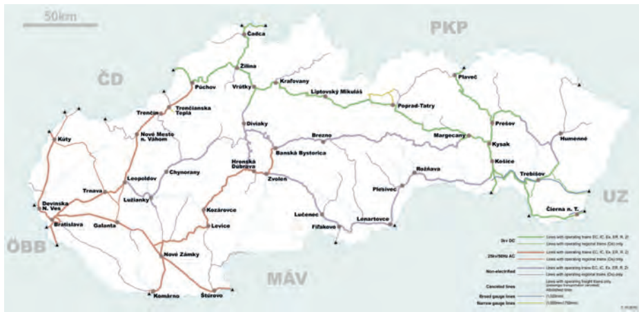
Abb.II.5.2 Schienennetz der Slowakei

umfassende Autobahnnetz. In den kommenden Jahren wird eine durchgehende Autobahn zwischen Bratislava – Žilina – Košice fertig gestellt werden, wobei bereits jetzt eine direkte Autobahnverbindung die Hauptstadt Bratislava mit Prag und Wien verbindet. In Richtung Budapest geht der Autobahnbau weiter voran. Das Schienennetz bedarf einer dringenden Modernisierung. Es ist insgesamt 3600 km lang, wovon nur 50 Prozent elektrifiziert sind. Die Slowakei verfügt über 172 km Wasserstraße auf der Donau und damit einen Zugang zum Schwarzen Meer und ist über den Rhein-Main-Donau-Kanal mit der Nordsee verbunden.