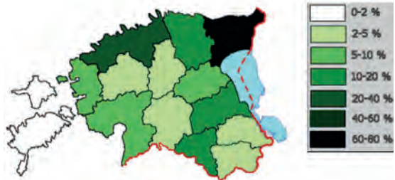
Abb.II.1.7 Verteilung der russischen Bevölkerung

Zusammenfassend belegt die oben dargestellte Differenzierung zwischen „Altrussen“ und „Neurussen“ in Estland, dass es gerechtfertigt erscheint, nicht nur verallgemeinernd von „der russischen Minderheit“ in Estland, sondern vielmehr differenzierend von „den russischen Minderheiten“ in Estland zu sprechen (FELDMANN 2003, KIRCH 1992, MAEDER-MECALF 1997). Darüber hinaus