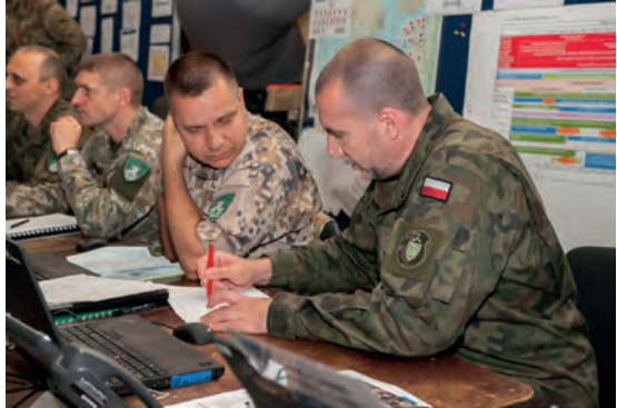
Abb.II.4.9 Arbeit im Gefechtsstand des MNC NE in Stettin während einer NATO-Übung Exercise Sabre Strike.

Angesichts der Ereignisse in der Ukraine wurden die Verteidigungsausgaben erhöht. In der Ende Mai 2017 veröffentlichten Verteidigungskonzeption werden für 2020 Ausgaben in Höhe von 2,2 Prozent des polnischen BIP veranschlagt, welche dann bis 2030 auf 2,5 Prozent steigen sollen. In diesem Dokument wird Russland als „Hauptquelle der Instabilität an der Ostflanke der NATO“ (MON 2017) bezeichnet, womit die Notwendigkeit steigender Verteidigungsausgaben begründet wird. Auch in Polen wird eine potentielle Gefahr eines begrenzten Angriffs russischer Streitkräfte in der polnisch-litauischen Grenzregion zur Schaffung einer Landverbindung zum Oblast Kaliningrad (Suwalki-Korridor) gesehen.