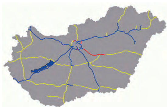
Abb.II.6.4 Autobahnnetz in Ungarn, blau: nutzbar, rot: im Bau, gelb: in Planung

Das Land verfügt über ein befestigtes Straßennetz von 76.100 km, wovon 1500 km Autobahn sind. Dabei sind Straßen und Autobahnen auf die Hauptstadt Budapest ausgerichtet. Absicht ist es, das Autobahnnetz flächendeckend auszubauen. Von dem 9200 km langen Schienennetz – ebenfalls Ausrichtung auf die Hauptstadt – sind 2900 km elektrifiziert. Physikalische Struktur und Verkehrsnetz machen Ungarn zu einer Drehscheibe für militärische Operationen in Ost-Südosteuropa in alle Richtungen.