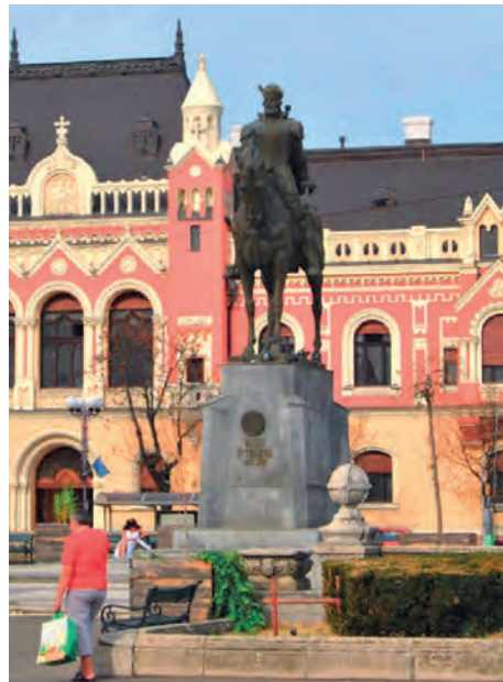
Abb.II.7.7 Michael der Tapfere (1558–1601); Standbild an einem symbolischen Ort erster Wahl in Oradea, das erst nach 1918 Rumänien zugeschlagen wurde.

Zusammenfassend liegen die Risiken des Landes bei der hohen Arbeitslosigkeit bzw. Unterbeschäftigung, Chancen zeigen sich weniger im Tourismus als vielmehr im Bereich der internationalen Logistik, der Arbeitsmigration sowie im lohnkostenintensiven Sektor der internationalen Arbeitsteilung. Als Schwäche kann die Vernachlässigung der inneren Peripherien gelten sowie die Gering-schätzung der multikulturellen Vergangenheit. Die Stärken des Landes könnten gerade in den Erfahrungen liegen, die an den Nahtstellen der Kulturen gesammelt wurden – doch diese Erkenntnis hat sich noch nicht durchgesetzt.