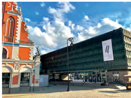
Abb.II.2.8 Das Okkupationsmuseum neben dem deutschgeprägten Schwarzhäupterhaus in Riga

Neben diesen Spannungen um Rechtsstellung und Sprache sorgt die unterschiedliche Wahrnehmung der jüngeren Geschichte für Disput: Russischstämmige Einwohner sehen in der einstigen sowjetischen Präsenz und dem Einmarsch der Roten Armee die heldenhafte Befreiung vom deutschen Nationalsozialismus. Viele der ethnischen Letten empfinden hingegen die Zeit während der Sowjetunion als Unterdrückung und die sowjetische Besetzung vor dem Einmarsch der Wehrmacht als Angriff auf die lettische Selbstbestimmung. Die Errichtung eines Okkupationsmuseums, das im Zentrum der Altstadt in Riga an die nationalsozialistischen wie sowjetischen Besatzungen von 1940–1991 erinnert, war daher heiß umstritten und gilt bis heute als Politikum.