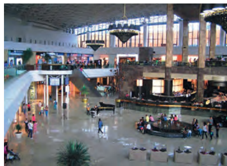
Abb.II.7.6 Iaşi (Moldau) – Erlebniseinkauf in der Palasmall bei Live-Musik

Die wirtschaftliche Transformation ist aber noch nicht abgeschlossen. Frei gesetzten Arbeitskräften mit geringer Qualifikation bleibt oft nur der Weg in die Arbeitslosigkeit, wenn sie nicht z. B. in der Subsistenzlandwirtschaft einen Unterschlupf finden. Ein anderer Ausweg ist die Arbeitsmigration, bevorzugt in romanischsprachige Länder, besonders nach Italien, Spanien oder Portugal. Mit ihren Remissen sorgen die Migranten einerseits dafür, dass der Rest der Familie in der Heimat überleben kann, andererseits investieren sie die Ersparnisse in Hausbauten oder örtliche