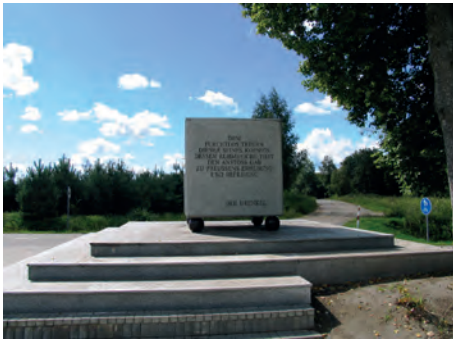
Abb.II.3.9 Konventionsdenkmal für Johann David Ludwig Graf Yorck von Wartenburg, dem Schöpfer der Konvention von Tauroggen und den Beginn der Freiheitskriege gegen Napoleon I. auf dem Gelände der ehemaligen Mühle von Poscherun in Litauen nahe der russischen Grenze.

Mit großem Enthusiasmus sind die Litauer 2004 sowohl der EU als auch der NATO beigetreten. Angesichts der mehr als 45jährigen Okkupation durch die Sowjetunion und der daraus erlittenen Unfreiheit waren diese Beitritte für alle Litauer generationsübergreifend Ausdruck einer Rückkehr in ein freiheitliches Europa.