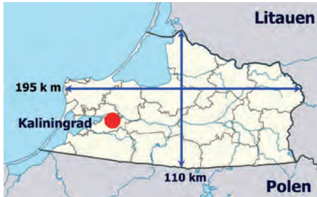
Abb.II.3.7 Russische Exklave Kaliningrad

Das Gebiet von Kaliningrad (ehemals Königsberg) ist etwa so groß wie Schleswig-Holstein. Vor dem Zweiten Weltkrieg gehörte das ehemalige Königsberg zu Ostpreußen und war Getreide-, Milch und Fleischlieferant für Deutschland. Nach 1945 fiel die Provinz an die Sowjetunion. Die 1,2 Millionen Deutschen wurden vertrieben und die Provinz von sowjetischen Bürgern besiedelt. Es ist der westlichste Teil Russlands. 700 Kilometer trennen das Gebiet vom übrigen russischen Territorium.