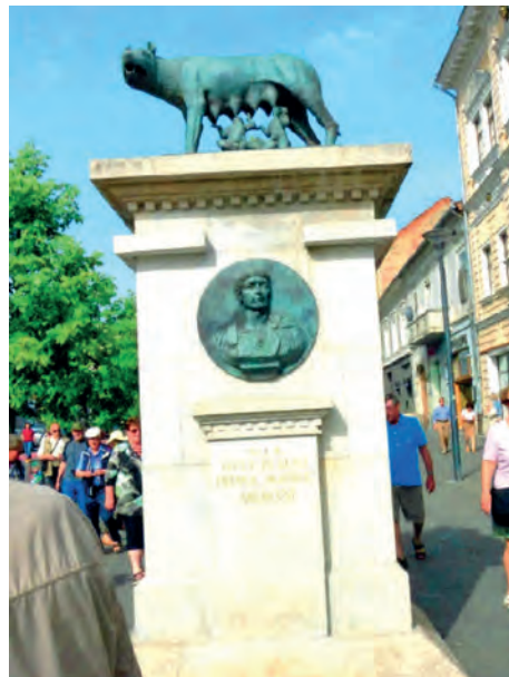
Abb.II.7.4 Kapitolinische Wölfin von 1921 in Cluj-Napoca/Klausenburg: Sinnbild der Romanitas

Mit der Entstehung des Nationalstaats ändert sich dies im 19. und 20. Jahrhundert. Geschichte wird national gedeutet, es entstehen Kontinuitätskonstrukte, die in rumänischer Perspektive bis in die Römerzeit zurückreichen. Aus der zeitlichen Tiefe werden Legitimation und Sonderstellung abgeleitet. Zwischen den Weltkriegen, in großrumänischer Zeit, wird das nationale Paradigma massiv durchgesetzt. Inbegriff der besonderen Position des Rumänischen ist der Rückbezug auf die Zeit des Imperium Romanum, der materiell in den Standbildern der Kapitolinischen Wölfin zum Ausdruck kommt, wie sie in vielen großen Städten des Landes zu sehen sind. Die so verstandene Romanitas (Dako-Romanismus) wird auch, und zwar mit Nachdruck, im zuvor ungarisch dominierten Siebenbürgen propagiert.