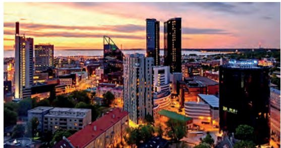
Abb.II.1.6 Tallinn bei Nacht

Obwohl der größte Teil der Bevölkerung Estlands keiner Konfession angehört, spielt der Faktor Religion über den Umweg des instrumentalisierten Ethnizität-Diskurs im Lande eine wichtige Rolle (REGELMANN 2017). Der weitaus überwiegende Teil der estnischen Bevölkerung ist konfessionslos, ca. 70 Prozent. Der Anteil der Mitglieder der Russisch-Orthodoxen Kirche macht etwa 12,8 Prozent aus; der evangelischen Kirche (Lutheraner) gehören 13,6 Prozent der Bevölkerung an. Die religiösen Minderheiten Estlands werden durch Katholiken (0,5 Prozent), Baptisten (0,5 Prozent) sowie Juden (0,1 Prozent), Muslime und weitere kleinere Religionsgemeinschaften repräsentiert.