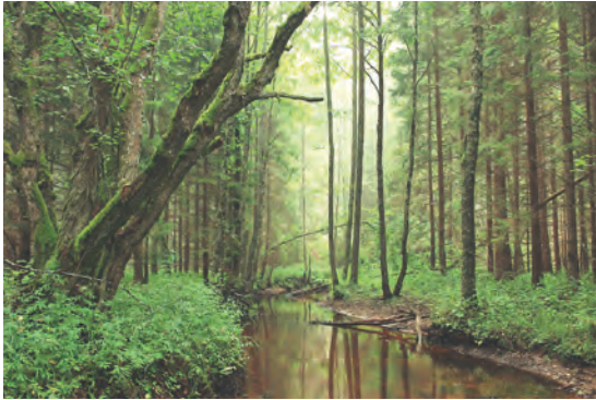
Abb.II.1.2 Dichtes, dschungelartiges Waldgebiet im südöstlichen Estland

ger für Ackerwirtschaft geeignet erscheinen, dennoch macht dieser Teil der landwirtschaftlichen Nutzfläche aus Gründen traditioneller Eigen- und Selbstversorgung etwa zwei Drittel aus.