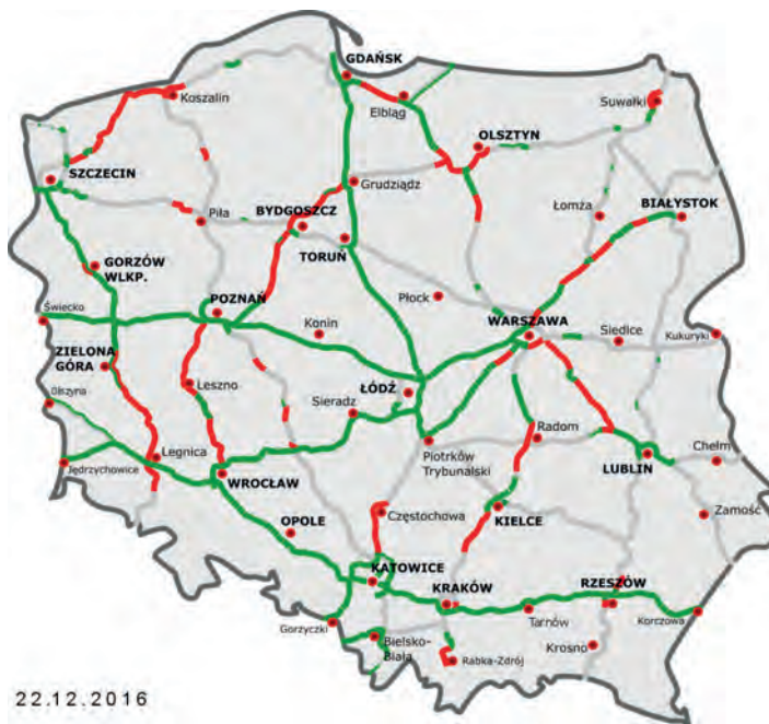
Abb.II.4.3 Verkehrsinfrastruktur Autobahnen, grün = verfügbar, rot = im Bau und grau = in Planung.

Obwohl es sich bei Polen um eins der bedeutendsten Länder innerhalb der EU handelt, muss man immer noch starke Mängel in der Verkehrsinfrastruktur konstatieren.