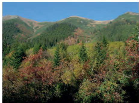
Abb.II.4.2 Hohe Tatra in Süden Polens

Geographisch betrachtet erstreckt sich Polen vom Kamm der Karpaten bis zur Ostsee und ist ein überwiegend flaches Land mit einer mittleren Geländehöhe von 173 m ü. NN. An der Ostseeküste schließt sich landeinwärts als Fortsetzung des Norddeutschen Tieflandes das Polnische Tief- und Plattenland an. Den nördlichen Teil nimmt eine stark sandige Jungmoränenlandschaft mit tausenden von Seen ein, welche durch die Weichselniederung in eine westliche (Pommersche) und östliche (Masurische) Seenplatte gegliedert wird. Das flachwellige Altmoränengebiet Mittelpolens wird von weiten Talniederungen durchzogen. Die Flüsse Weichsel, Bug, Warthe und Netze folgen streckenweise eiszeitlichen Urstromtälern. Nach Süden geht das Tiefland in die Berg- und Hügelländer Oberschlesiens, Kleinpolens und Galiziens über. In den Sudeten (höchste Erhebung ist die 1602 Meter hohe Schneekoppe) und den Beskiden (höchste Erhebung ist die Babia Gora mit