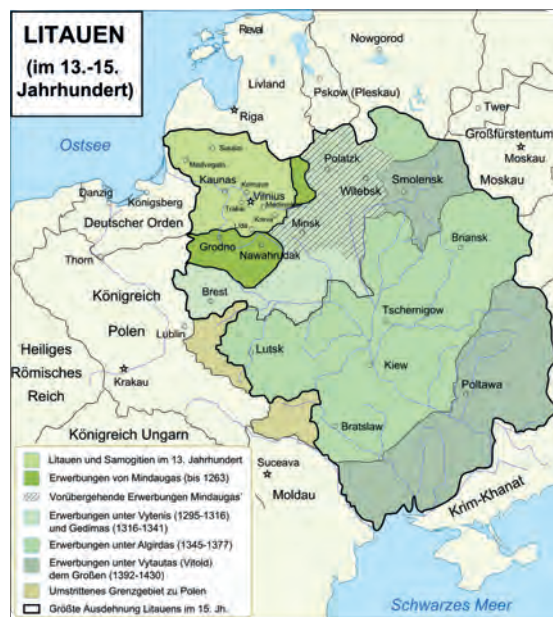
Abb.II.3.2 Großfürstentum Litauen im 13. bis 15. Jahrhundert

Die Geschichte Litauens ist mit der von Russland, Weißrussland (Belarus), Deutschland und Polen eng verbunden. Die erste Erwähnung Litauens in westlichen Quellen stammt aus dem Jahr 1009. Im 13. Jahrhundert trat Litauen als geintes Staatswesen in Erscheinung. Die umliegenden Staaten betrachteten die baltischen Länder, auch Litauen, im Mittelalter als letzten Hort des europäischen „Heidentums“, als potentielles Missionsgebiet der Kirchen und Expansionsgebiet des livländischen und preußischen Ritteradels. Ab 1385 ging Litauen eine Personalunion mit dem Königreich Polen ein. Der anhaltende innere und äußere Niedergang Polen-Litauens ab 1648 führte dazu, dass Litauen zusammen mit Polen 1795 nach mehreren Teilungen von der politischen Landkarte Europas verschwand. Litauen blieb bis 1917 Teil des Russischen Kaiserreiches und erlangte 1918 die Unabhängigkeit.