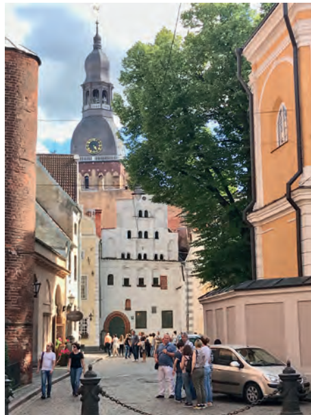
Abb.II.2.4 Hauptstadt Riga

Ethnische Letten stellen mit 62 Prozent der Einwohner die Mehrheit der Bevölkerung. Ihr Anteil ist damit etwa doppelt so groß wie der der ethnischen Russen von ca. 27 Prozent. In der Hauptstadt Riga sind 50 Prozent der Einwohner russischstämmig. In der zweitgrößten Stadt Daugavpils stellen Letten sogar nur etwa 20 Prozent. Weitere russischsprachige Gruppen wie Weißrussen, Ukrainer, Polen und Litauer machen insgesamt weitere zehn Prozent aus. Zwischen den lettischen und den russischsprachigen Bevölkerungsgruppen besteht ein massives Spannungsverhältnis, das auch dem besonderen Konstrukt der „Nichtbürger“ zugrunde liegt. Auf dieses wird in einem gesonderten Abschnitt eingegangen. Esten, Deutsche, Roma und Tataren stellen kleinere Minderheiten. 2880 Suiti – eine katholische Gruppierung – und ca. 170 nicht mit den Letten assimilierte