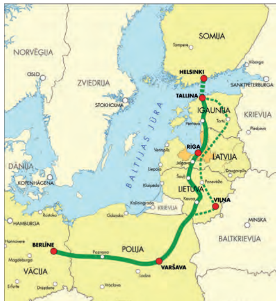
Abb.II.2.5 Rail Baltica

Der Schienenverkehr verwendet das Breitspurschienennetz Russlands, das nicht mit den europäischen Spurbreiten kompatibel ist