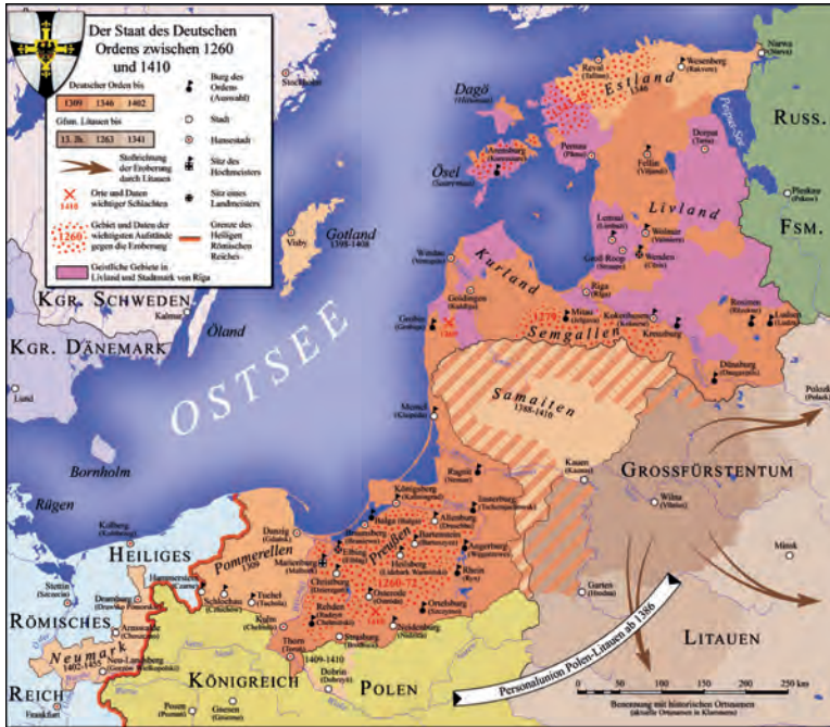
Abb.II.1.3 Besiedlung des Deutschen Ordens im Baltikum

sen Autonomiestatus wahr, der auch von der schwedischen Oberhoheit im nördlichen Ostseeraum bestätigt wurde. Auch nachdem Schweden im Großen Nordischen Krieg 1710 gegen Russland unterlegen war, blieben diese Selbstverwaltungsprivilegien weiterhin bestehen.