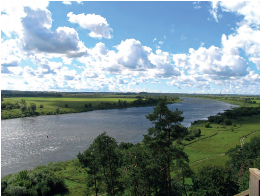
Abb.II.3.10 Blick von Taurage auf Sowjets (ehemals Tilsit) am Grenzfluss Memel

Der 67jährige ehemalige Bürgermeister von Taurage, der den Übergang Litauens von der sowjetischen Besatzung hin zu einem demokratischen Staat begleitet hatte, berichtete, dass die ehemals guten Beziehungen zwischen Litauen und Russland an vielen Stellen nicht abgerissen seien und von zahlreichen Litauern wie ihm bis heute gepflegt werden. Er selber habe nach wie vor sehr gute Kontakte in die russische Kommunalverwaltung und zu seinen ehemaligen Ansprechpartnern in Moskau und über die Jahre seien auch zahlreiche neue Kontakte hinzugekommen. Er erläutert, dass Russland auch heute noch großes Interesse an der Entwicklung in den baltischen Staaten habe, insbesondere ist man sehr am infrastrukturellen Ausbau der Kommunen in Litauen interessiert. Auf Fragen zur aktuellen Politik Litauens gegenüber Russland reagierte er sehr reserviert und zurückhaltend. Man konnte fast den Eindruck gewinnen, dass er auch 25 Jahre nach der Wiederherstellung der politischen Freiheit in Litauen sehr skeptisch war, ob dies in Zukunft so Bestand haben werde.