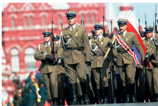
Abb.II.4.8 Polnische Militärformation bei einer Parade. Die polnischen Streitkräfte haben zwei optische Alleinstellungsmerkmale: Der Gruß mit zwei Fingern und eine viereckige Mütze.

Im Hinblick auf das Verhältnis zu Russland muss man von einer erheblichen Verschlechterung der bilateralen Beziehungen sprechen, welche vor allem nach der Katastrophe von Smolensk einsetzte und sich im Zuge der Kämpfe in der Ukraine und dem damit aufkommendem Bedrohungsgefühl vertiefte, was vor allem daran lag, dass die bürgerlich-liberale Regierung, die von 2007 bis 2015 in Polen an der Macht war, aus russischer Perspektive betrachtet, zu einem Erfüllungsgehilfen der USA wurde (BIALEK 2016) und eine rein transatlantische Ausrichtung vertrat. Die Verhandlungen zwischen Polen und den USA bezüglich der Installation von Teilen eines globalen Raketenabwehrsystems im polnischen Redzikow werden von Moskau als unverantwortliche Gefährdung der internationalen Sicherheitsarchitektur angesehen (PIWAR 2016). Der russische Botschafter in Warschau stellte jedoch im selben Atemzug heraus, dass Russland an eine Verbesserung der bilateralen Beziehungen zwischen beiden Staaten glaubt, sofern Polen seine einseitige Ausrichtung der Außenpolitik Richtung Washington aufgibt. Sollte dies erfolgen, so der Botschafter, könnten Russland und Polen auf jedem Gebiet zusammenarbeiten.