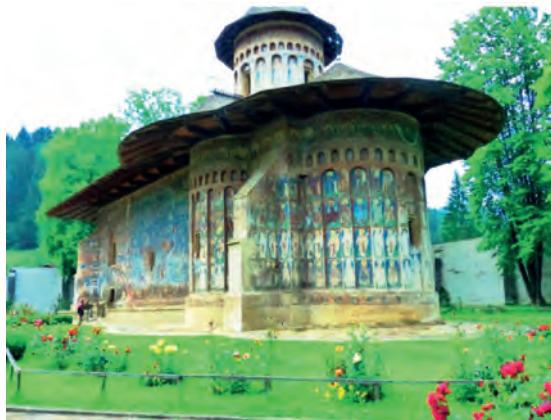
Abb.II.7.8 Moldaukloster Voronet; Inbegriff (1.) der rumänisch-orthodoxen Klosterwelt, (2.) der lange umkämpften moldauisch-osmanischen Kontaktzone sowie (3.) des heutigen Weltbetourismus.

Die Perspektiven für Rumänen und auf Rumänien haben sich grundlegend gewandelt. Das Karpatenland mit seinen fruchtbaren Schwarzerdeböden bietet hervorragende landwirtschaftliche Perspektiven, in Industrie und Gewerbe sind Internationalisierung und Globalisierung auf dem Vormarsch, die Probleme des Arbeitsmarkts werden durch internationale Migration und Rissen gemindert. Das Land und seine Bewohner bekommen durch die EU-Integration ein neues Pro-