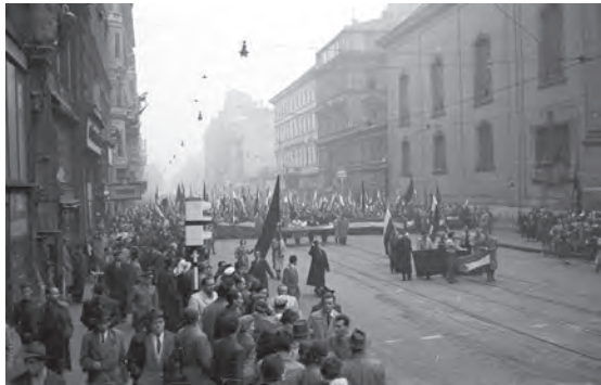
Abb.II.6.7 Demonstrationen in Budapest, die in den Aufstand von 1956 mündeten.

Die unter Nikita Chruschtschow auf dem XX. Parteitag der KPdSU im Februar 1956 eingeleitete Entstalinisierung brachte zwar den Sturz Rákosis mit sich. Es konnte nicht verhindert werden, dass die wachsende Unzufriedenheit mit der kommunistischen Einparteien-Diktatur, der anhaltende Terror und das Vorbild des Aufstandes in Polen im Oktober 1956 zum „Ungarnaufstand“ führten. Durch den Einsatz sowjetischen Truppen wurde er niedergeschlagen. Die westliche Welt hielt sich zurück, obwohl ein Eingreifen in einigen westlichen Staaten, darunter den USA, von gesellschaftlichen Gruppen gefordert wurde.