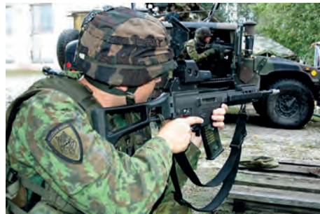
Abb.II.3.5 Litauische Infanterie beim Gegenangriff

Die Aus- und Weiterbildung der litauischen Soldaten wird zentral koordiniert. Für die Ausbildung stehen das Hetman Jonušas Radvila Ausbildungsregiment, das General Adolfas Ramanauskas Kampfttrainingszentrum und die Divisionsgeneral-Stasys-Raštikis-Militärschule zur Verfügung. Die Offiziersausbildung erfolgt an der General Jonas-Žemaitis-Militärakademie. Darüber hinaus gibt es zahlreiche Bildungseinrichtungen, die gemeinsam mit den estnischen und lettischen Streitkräften betrieben werden. Hier sei beispielhaft nur die Baltische Verteidigungsakademie (BALTDEFCOL) in Tartu genannt, an der die angehenden Stabsoffiziere der baltischen Republiken ausgebildet werden.