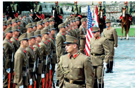
Abb.II.6.9 Ehrenformation in ihrer aktuellen traditionell gestalteten Paradeuniform.

Die Sicherheitspolitik Ungarns konzentriert sich auf den Schutz des Staatsgebietes und die Integrität der Grenzen sowie Stabilität und Ruhe im Inland. Neben Polizei mit integriertem Grenzschutz und Zoll sind die Streitkräfte das bedeutendste Instrument der Sicherheitspolitik. Das Verteidigungsbudget liegt etwas über einer Milliarde Euro, was knapp ein Prozent des BIP entspricht. Damit liegt Ungarn deutlich hinter den zwei Prozent der Erwartungen der NATO zurück, was der wirtschaftlichen Lage und den finanziellen Möglichkeiten des Landes geschuldet zu sein scheint.