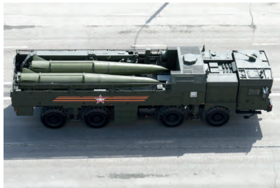
Abb.II.3.8 Wahrgenommene Bedrohung im Baltikum: Russische Iskander Kurzstrecken-Raketen

Im Jahr 2015 verlegte das russische Militär während eines großangelegten Manövers eine moderne Iskander-Kurzstrecken-Raketeneinheit nach Kaliningrad, um eine schnelle Reaktionsfähigkeit zu demonstrieren. Die Iskander-Raketen können mit konventionellen und nuklearen Sprengköpfen ausgestattet werden und haben eine Reichweite von 500 Kilometern. Damit können sie einen großen Teil Polens erreichen. Die Iskander-Raketen wurden nach den Manövern zurück an ihre ursprünglichen Standorte in Russland gebracht. Russland hat aber damit unter Beweis gestellt, dass die Raketen langfristig jederzeit erneut in der Kaliningrader Region stationiert werden könnten.