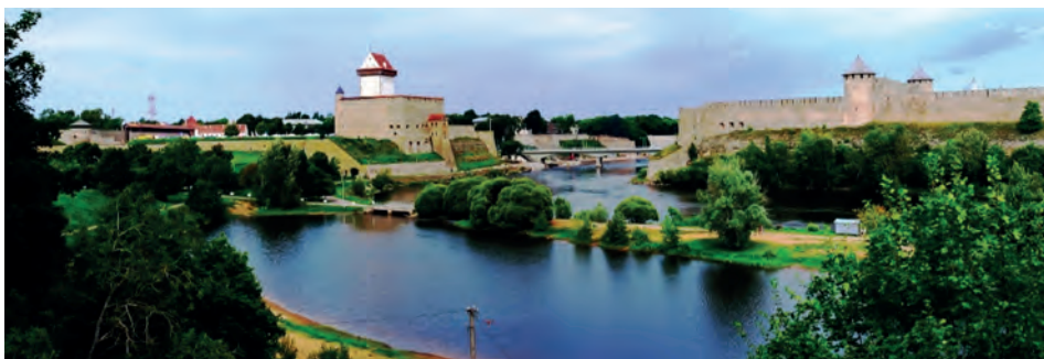
Abb.II.1.9 Estnisch-russischer Grenzfluss Narva

Estnische Politiker im Besonderen und baltische Akteure im Allgemeinen hatten es dabei in den letzten Jahren schwer, den Westen von der unmittelbaren Bedrohung durch Russland zu überzeugen und entsprechenden Beistand zu organisieren. Sie bekommen aber seit Mitte 2015 zunehmend breite westliche Unterstützung (DER SPIEGEL 2016, METZ 2016) durch breitangelegte gemeinsame NATO-Manöver im baltisch-polnischen Raum.