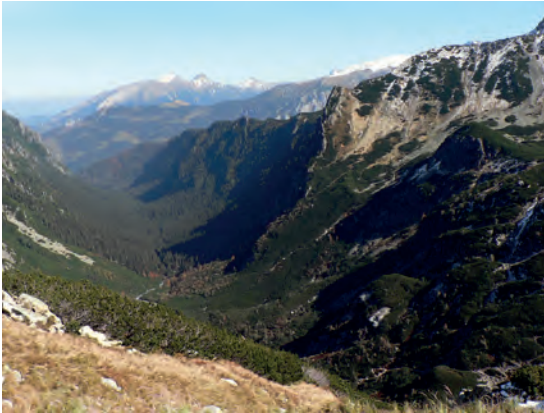
Abb.II.5.4 Hohe Tatra

Territoriums sind bewaldet, wobei man die größten Waldgebiete in der Niederen Tatra, in der Großen und Kleinen Fatra und im slowakischen Erzgebirge findet. Die ehemals reichen Bodenschätze der Slowakei, zum Beispiel Kupfer, Blei, Eisenerz, Braunkohle und Steinkohle sind heute weitgehend abgebaut und erschöpft.