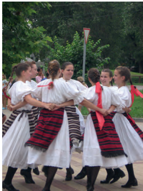
Abb.II.6.8 Ungarischer Volkstanz

Das Durchschnittsalter der ungarischen Bevölkerung liegt bei 41,8 Jahren. Das Bevölkerungswachstum ist mit -0,24 Prozent leicht rückläufig. Die Geburtenrate beträgt 9,1 Lebendgeburten auf 1000 Einwohner. Das bedeutet, dass Ungarn ähnliche Probleme mit der Überalterung der Gesellschaft drohen, wie sie auch in anderen europäischen Staaten bestehen. 85,6 Prozent aller Einwohner Ungarns bezeichnen sich als ethnische Ungarn, 3,2 Prozent als Sinti bzw. Roma und 1,9 Prozent als Deutsche. Weitere 16,7 Prozent sind Slowaken, Polen, Ruthenen, Armenier, Bulgaren, Kroaten, Serben, Slowenen, Ukrainer und Rumänen. Der Ausländeranteil betrug 2015 ca. 1,5 Prozent der Gesamtbevölkerung. In Bezug auf die Konfessionszugehörigkeit sind 37,2 Prozent der Ungarn römisch-katholisch, 11,6 Prozent Calvinisten, 2,2 Prozent Lutheraner, 1,8 Prozent griechisch-katholisch, 18,2 Prozent konfessionslos und 27,2 Prozent machten keine Angabe (Volkszählung 2011). Die ethnischen Gruppen sind weitgehend in die Gesellschaft integriert. In Ungarn gibt es keine sicherheitspolitisch relevanten ethnischen Konflikte.