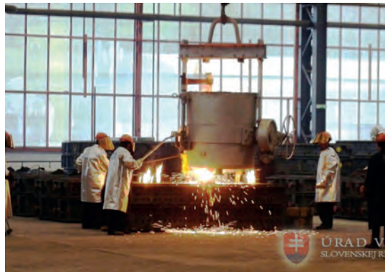
Abb.II.5.5 Slowakisches Stahlwerk