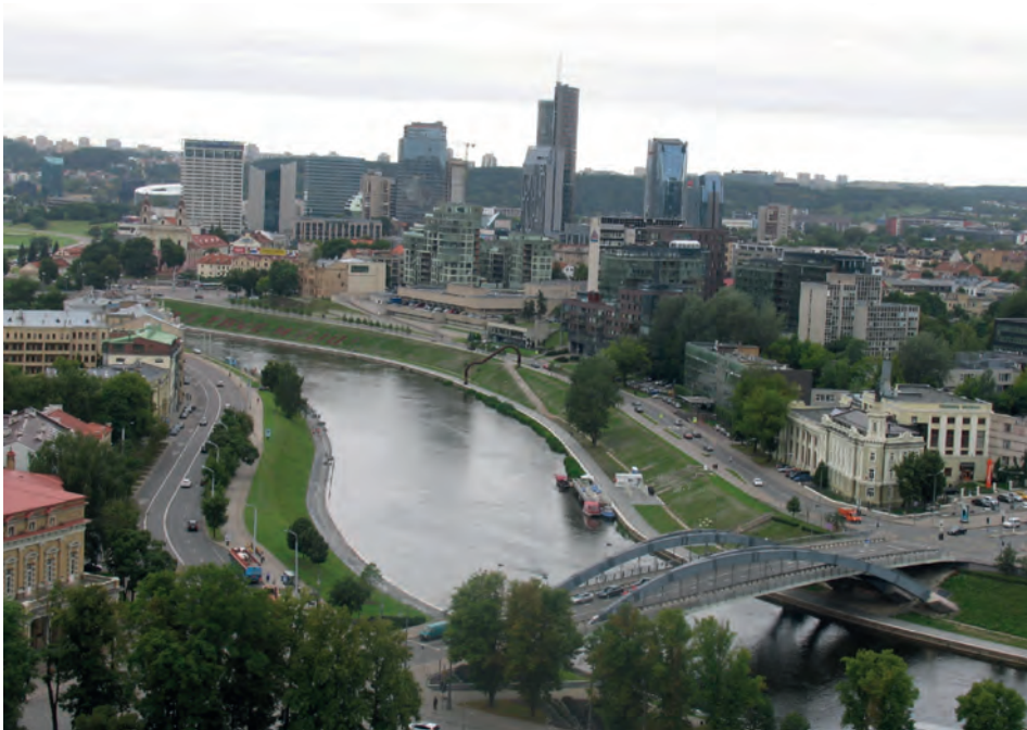
Abb.II.3.4 Blick vom Gediminas Turm über die Neris auf das neue Bankenviertel von Vilnius

Litauen hat ca. 2,9 Millionen Einwohner (Schätzung Mitte 2015), weitere ca. 800.000 bis eine Million Litauer leben im Ausland. Die Bevölkerungsdichte ist 44 E/km 2 , im Vergleich zu Deutschland, dort leben 226 E/km 2 (Stand 2013). Das Bevölkerungswachstum ist rückläufig und betrug ein Prozent in 2015. In Litauen leben 85 Prozent Litauer, 6,5 Prozent Polen, 6,5 Prozent Russen und Weißrussen und ca. zwei Prozent sonstige Ethnien. Konfessionell sind 79 Prozent Katholiken, 9,5 Prozent konfessionslos, 4,1 Prozent Russisch-Orthodoxe, 1,9 Prozent Protestanten und ca. acht Prozent gehören anderen Religionen an. Staatssprache ist Litauisch. Daneben gibt es Russisch, Englisch und Deutsch als Geschäftssprachen und Polnisch, Weißrussisch, Jiddisch als Minderheitensprachen. Die Analphabetenrate beträgt nur 0,2 Prozent. Der größte Teil der Bevölkerung lebt in den Städten, ca. 67 Prozent. Die größten Städte sind Vilnius/Wilna (Hauptstadt) mit ca. 531.900 Einwohnern, Kaunas mit 301.400 Einwohnern, Klaipėda/Memel mit 156.100 und Šiauliai/Schaulen mit 104.600 Einwohnern. (CLEMENS 2010)