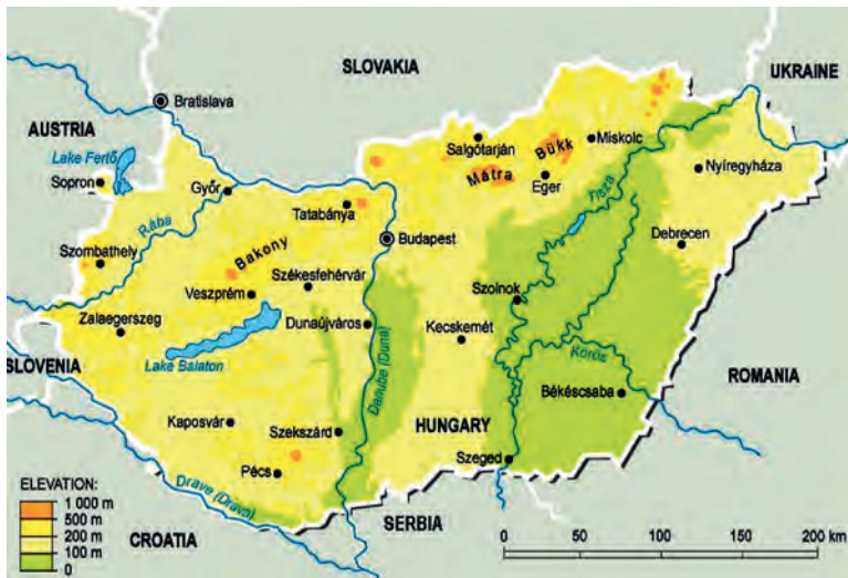
Abb.II.6.2 Topographische Darstellung Ungarns