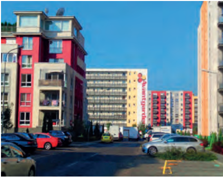
Abb.II.7.5 Neue Eigentumswohnungen am Stadtrand von Braşov/Kronstadt

Wohnungen; heute regeln Eigentümergemeinschaften alle anfallenden Probleme in den Bereichen Renovierung, Gemeinschaftseinrichtungen und Wohnumfeld. Parallel entstehen vielerorts nach der Jahrtausendwende postmoderne randstädtische Apartmentanlagen, Reihenhäuser und Villen, aber auch genossenschaftliche Wohnungen für Minderbegüterte. In den Dörfern bilden die Renovierungs- und Neubauaktivitäten das Pendant hierzu.