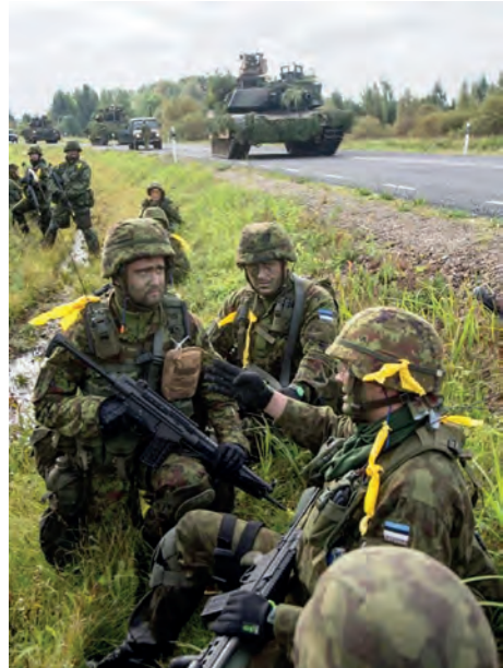
Abb.II.1.8 Estnische und amerikanische Truppen bei einer Übung im Baltikum

Territoriale Aufgaben übernimmt eine Heimwehr aus Reservisten (Defence League, Katseliit) mit 15 Distriktkommandos und nachgeordneten Einheiten in einer Stärke von etwa 11.000 Mann, deren Zielgröße 30.000 in den nächsten Jahren vorgesehen ist. Sie hat eine eigene Ausbildungseinrichtung, Jugend- und Frauenorganisation. Die Mitglieder der Reserve haben Waffen und Uniformen zuhause und sind in Friedenszeiten in zahlreiche zivilrechtliche Aufgabenbereichen (wie etwa Waldbrandbekämpfung, Veranstaltungssicherung etc.) eingebunden.