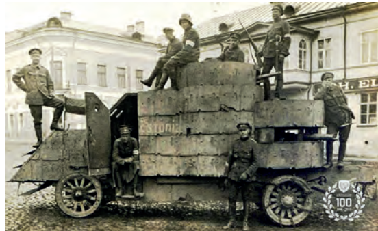
Abb.II.1.4 Panzerfahrzeug der estnischen Streitkräfte 1918

birien sowie Deportationen, die sich vor allem gegen Intellektuelle, Wohlhabende und Angehörige der estnischen Führungsschicht richten. Viele überlebten den Gulag nicht. Von diesen Maßnahmen waren vor allem ethnische Esten betroffen, da viele Bewohner mit deutschen Wurzeln bereits kurz vorher unter der politischen Doktrin „Heim ins Reich“ nach Deutschland umgesiedelt worden waren.