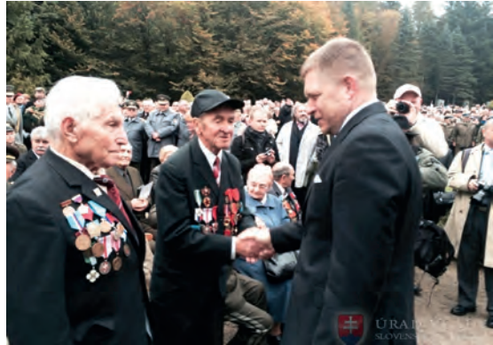
Abb.II.5.6 Ehrung von Veteranen

Oberbefehlshaber der Streitkräfte ist der Staatspräsident. Der Einsatz der Streitkräfte erfolgt auf der Basis von Parlamentsbeschlüssen. Die Streitkräfte bestehen aus Heer und