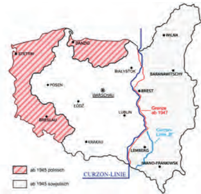
Abb.II.4.5 Neue polnische Grenzen nach dem Zweiten Weltkrieg

Die Neuordnung Europas begann auf der Konferenz von Teheran (28.11.–1.12.1943), als die westlichen Vertreter der sowjetischen Forderung nachgaben, nach Beendigung des Krieges Polen dem Einflussbereich der Sowjetunion zu überlassen. Dies bedeutete de facto die Unterwerfung eines zukünftigen Polen unter den sowjetischen Totalitarismus. Diese Beschlüsse wurden der polnischen Exilregierung vorenthalten, welche ihren Sitz in London hatte. Das geschah, obwohl Polen ein Alliiertes der Westmächte war.