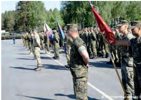
Abb.II.5.8 Abschlussappell einer NATO-Übung in der Slowakei

Wie in Ungarn und in Polen, ist auch in der Slowakei nicht davon auszugehen, dass sich der eingeschlagene EU-skeptische Kurs und die nationalkonservativen politischen Tendenzen in den kommenden Jahren ändern werden. Die jetzige Regierung in der Slowakei ist im Jahr 2016 bestätigt worden und das Parlament um eine noch radikalere nationalistische Partei ergänzt worden. Die EU-Ratspräsidentschaft vom 1. Juli 2016 bis zum 31. Dezember 2016 – die erste seit dem Beitritt der Slowakei 2004 – hat die Slowakei technisch gut gemeistert, jedoch änderte dies nichts am Verhältnis des Durchschnitts-Slowaken zur EU. Diese sei weit Weg und die Bürokraten dort haben mit dem Alltag der Menschen nichts zu tun (KIRCHGESSNER 2016).