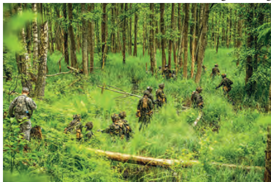
Abb.II.2.6 US- und kanadische Truppen bei der Übung Sabre Strike 2014 im waldreichen ostwärtigen Grenzgebiet Lettlands

Lettland hat sich trotz seiner geringen militärischen Stärke seit 1996 an zahlreichen Auslandseinsätzen beteiligt, um in der NATO und EU seine partnerschaftlichen Absichten zu beweisen. Zu diesen gehören die Operation Iraqi Freedom im Irak, der ISAF-Einsatz in Afghanistan, die ALTHEA Operation der