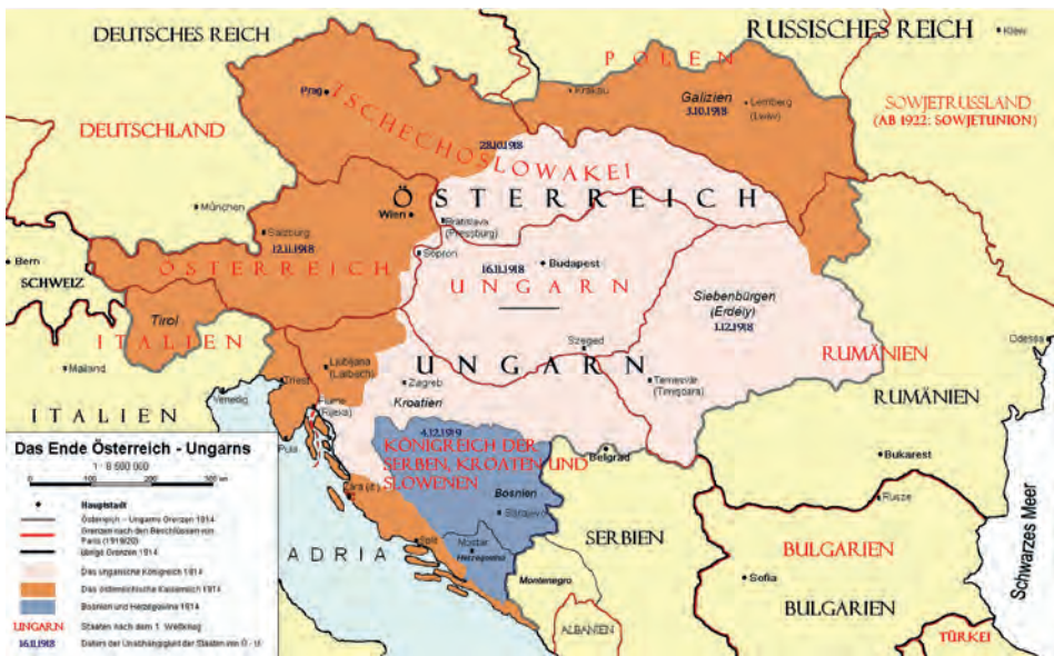
Abb.II.6.6 Aufteilung von Trianon; in der Mitte das räumlich deutlich kleinere heutige Ungarn.

Zurück in Budapest proklamierte er am 16. November 1918 die Republik Ungarn und wurde am 16. Januar 1919 zum provisorischen Präsidenten ernannt. Die harten Waffenstillstandsbedingungen und die Fortsetzung der alliierten Seeblockade gegen die Mittelmächte verursachten ein unbeschreibliches Elend in den großen Städten. Das war der ideale Nährboden für die Errichtung einer bolschewistischen Räterepublik unter Béla Kun am 21. März 1919. Der einsetzende bolschewistische Terror nach dem Muster der Sowjetunion und die Unfähigkeit der ungarischen Räteregierung, der Not leidenden Bevölkerung rasche Abhilfe zu verschaffen, isolierten diese schnell. Konservative Kräfte kamen mit „weißem“ Gegenterror an die Macht und setzten am 1. März 1920 Admiral Miklós Horthy als Reichsverweser ein. Das war der Beginn einer 24 Jahre währenden autoritären Herrschaft. Die Regierung Horthy war unter Widerspruch gezwungen, am 4. Juni 1920 den Friedensvertrag von Trianon zu unterschreiben. Ungarn verlor über 70 Prozent des bisherigen Staatsgebiets und damit zwei Drittel der Bevölkerung, darunter 2,5 Millionen Ungarn.