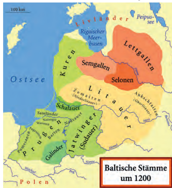
Abb.II.2.2 Baltische Stämme um 1200

Riga wurde 1282 deutsche Hansestadt. Bis heute prägt der deutsche Einfluss die markante Altstadt. Mit der vernichtenden Niederlage des Deutschen Ordens bei Tannenberg fielen Teile Lettlands 1410 an das römisch-