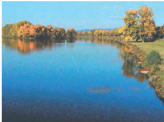
Abb.II.5.3 Fluß Waag

Die Vegetation in der Slowakischen Republik wird stark durch die Höhenstufung geprägt. Bis 500 m ü. NN wachsen vorwiegend Laubwälder, welche meistens aus Eichen und Hainbuchen bestehen, bis 1000 m ü. NN Mischwälder und darüber Nadelwälder. Oberhalb der Waldgrenze, die bei 1500 m ü. NN liegt, findet man Latschen und Zirbelkiefern, die ab 1650 m ü. NN von alpinen Matten abgelöst werden. In den abgelegenen Regionen der Slowakei finden sich Tierarten, die in