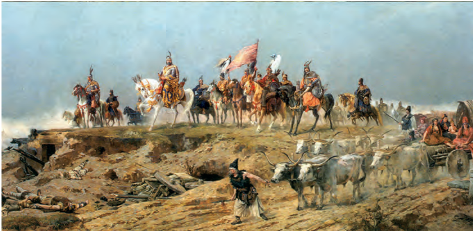
Abb.II.6.5 Madjarische Reitervölker – Vorfahren der Ungarn

Der Erste Weltkrieg und der durch ihn verursachte Zusammenbruch der europäischen Staatenwelt markiert für die Geschichte der heutigen Republik Ungarn eine der wesentlichen Zäsuren. Im Rahmen der dualistisch gegliederten österreichisch-ungarischen k. u. k. Monarchie, welche ein von inneren Spannungen geprägter Vielvölkerstaat war, zog Ungarn am 28. Juli 1914 in den Krieg. (CLARK 2013). Im Verlauf des Krieges, der für Österreich-Ungarn fatal war, wurden die Nationalitätenkonflikte innerhalb der Doppelmonarchie immer deutlicher und spätestens mit dem Kriegseintritt der USA 1917 und der Verkündung des „14-Punkte-Plans“ des amerikanischen Präsidenten Woodrow Wilson am 8. Januar 1918 wurde deutlich, dass nach einer Niederlage der Mittelmächte mit einer Aufteilung der Doppelmonarchie gerechnet werden musste (KRÜGER 2012). In Bezug auf Österreich-Ungarn führte Wilson aus: „Den Völkern Österreich-Ungarns, deren Platz unter den Nationen wir gefestigt und gesichert zu sehen wünschen, sollte die freiste Möglichkeit autonomer Entwicklung gewährt werden...“ (Zitiert nach LAUTEMANN und SCHLENKE 1975). Das Selbstbestimmungsrecht der Völker bedeutete in seiner praktischen Umsetzung das Entstehen einer ganzen Reihe neuer Staaten auf dem Gebiet des früheren Vielvölkerstaates Österreich-Ungarn.