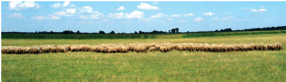
Abb.II.6.3 Ungarische Tiefebene

Das Land wird von einem weitmaschigen Flussnetz durchzogen, wovon die Donau, die Drau, die Theiß und die Raab die bedeutendsten sind. Sie fließen ins Schwarze Meer. (ZGEOBW 2015). Die Bedeutung der Gewässerläufe ergibt sich aus über 1600 km schiffbarer Wasserstraßen auf der Donau und der Theiß und der Verbindung mit dem Rhein-Main-Donau-Kanal bis zur Nordsee.