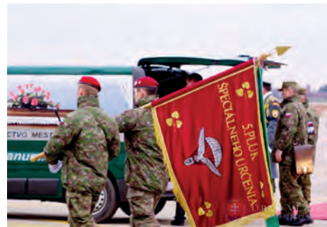
Abb.II.5.7 Ehrung gefallener slowakischer Soldaten aus dem Afghanistan-Einsatz

Die Slowakei trat 2004 der NATO bei, nachdem sie bereits Mitte der 1990er Jahre am PfP-Programm teilnahm. Seit 2011 ist die Slowakei für das NATO Centre of Excellence für EOD, d. h. Kampfmittelbeseitigung, zuständig. 2016 wurde die NATO Force Integration Unit (NFIU) zur Aufnahme von Schnelleingreifkräften (VJTf) der NRF in Bratislava aufgestellt. Die Slowakei hat auch zugesagt, sich mit Kräften an der von Rumänien als Leadnation aufzustellenden Multinationalen Division Südost (MND SE) neben weiteren zehn Nationen zu beteiligen. Die Slowakei wirkt damit an der Umsetzung der in Wales (2014) und Warschau (2016) beschlossenen Bündnisverteidigung im Rahmen des Rapid Action Plans im Rahmen seiner finanziellen Möglichkeiten und militärischen Fähigkeiten mit. Wie andere osteuropäische NATO- bzw. EU-Staaten kann auch die Slowakei ihre Ostgrenze nur im Bündnisrahmen durchhaltefähig und nachhaltig verteidigen.