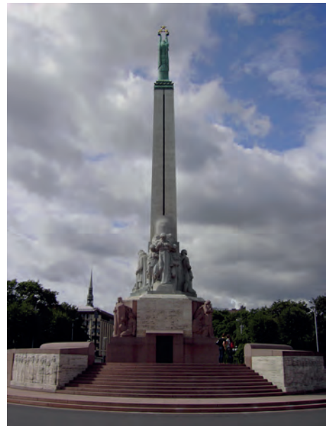
Abb.II.2.3 Lettisches Freiheitsmonument in Riga

Lettland wurde nach dem Zweiten Weltkrieg als „Lettische Sozialistische Sowjetrepublik“ (LSSR) Bestandteil der Sowjetunion. Es bildete sich 1945 eine lettische Befreiungsbewegung, die mit litauischen und estnischen Gruppen als sog. „Waldbrüder“ bewaffneten Widerstand leisteten. Um diesen Widerstand zu brechen, führten die Sowjets mit Hilfe lettischer Kommunisten im März 1949 weitere Massendeportationen nach Zentralasien