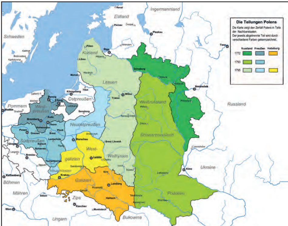
Abb.II.4.4 Polnische Teilungen 1772 bis 1795

Der Verlauf des Krieges führte dazu, dass sich frühere polnische Gebiete unter Kontrolle der Mittelmächte befanden. Daraus ergab sich das Problem, wie mit diesen nach dem Krieg umzugehen sei. Eine der wichtigsten Ideen zur Neuordnung dieses geographischen Raumes war die sog. Mitteleuropa-Konzeption des liberalen Politikers Friedrich Naumann. Sie sah die Gründung eines Staatenbundes zwischen Österreich-Ungarn und Deutschland mit einem autonomen Polen unter deutscher „Aufsicht“ vor (NAUMANN 1915). Im Vertrag von Brest-Litowsk (3. März 1918) findet sich in diesem Zusammenhang die Absichtserklärung, „... das künftige Schicksal dieser Gebiete [d. h. unter anderem der polnischen Gebiete. M.W.] im Benehmen mit deren Bevölkerung zu bestimmen“ (LAUTEMANN, SCHLENKE 1961).