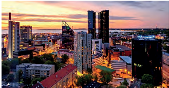
Abb.II.1.6 Tallinn bei Nacht

Obwohl der größte Teil der Bevölkerung Estlands keiner Konfession angehört, spielt der Faktor Religion über den Umweg des instrumentalisierten Ethnizität-Diskurs im Lande eine wichtige Rolle (REGELMANN 2017). Der weitaus überwiegende Teil der estnischen Bevölkerung ist konfessionslos, ca. 70 Prozent. Der Anteil der Mitglieder der Russisch-Orthodoxen Kirche macht etwa 12,8 Prozent aus; der evangelischen Kirche (Lutheraner) gehören 13,6 Prozent der Bevölkerung an. Die religiösen Minderheiten Estlands werden durch Katholiken (0,5 Prozent), Baptisten (0,5 Prozent) sowie Juden (0,1 Prozent), Muslime und weitere kleinere Religionsgemeinschaften repräsentiert.