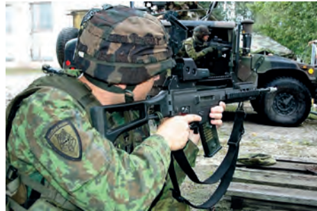
Abb.II.3.5 Litauische Infanterie beim Gegenangriff

Die Aus- und Weiterbildung der litauischen Soldaten wird zentral koordiniert. Für die Ausbildung stehen das Hetman Jonušas Radvila Ausbildungsregiment, das General Adolfas Ramanauskas Kampftrainingszentrum und die Divisionsgeneral-Stasys-Raštikis-Militärschule zur Verfügung. Die Offiziersausbildung erfolgt an der General Jonas-Žemaitis-Militärakademie. Darüber hinaus gibt es zahlreiche Bildungseinrichtungen, die gemeinsam mit den estnischen und lettischen Streitkräften betrieben werden. Hier sei beispielhaft nur die Baltische Verteidigungsakademie (BALTDEFCOL) in Tartu genannt, an der die angehenden Stabsoffiziere der baltischen Republiken ausgebildet werden.