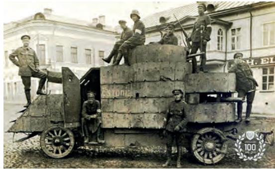
Abb.II.1.4 Panzerfahrzeug der estnischen Streitkräfte 1918

birien sowie Deportationen, die sich vor allem gegen Intellektuelle, Wohlhabende und Angehörige der estnischen Führungsschicht richten. Viele überlebten den Gulag nicht. Von diesen Maßnahmen waren vor allem ethnische Esten betroffen, da viele Bewohner mit deutschen Wurzeln bereits kurz vorher unter der politischen Doktrin „Heim ins Reich“ nach Deutschland umgesiedelt worden waren.