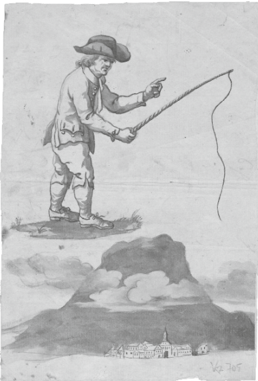
Abb. 8: Brüder Grimm, Fuhrmann mit Peitsche, Stadt vor einem Vulkan (Ätna mit der Stadt Catania?), vermutlich 1800–1802, lavierte Federzeichnung © Hessisches Staatsarchiv Marburg, Bestand 340 Grimm, Nr. B 312.

So ist in der linken oberen Bildhälfte ein energisch agierender Kutscher/Fuhrmann mit Peitsche zu sehen, der auf einer Art „Bodenwolke mit Grasbüscheln“ über einem vulkanartigen dunklen Berg schwebt. Dieser ist von einem Wolkenband umgeben, das von einer Stadt mit Kirche gesäumt wird. Ein ähnliches Motiv findet sich in der formalästhetischen Ausformulierung auf der ersten Tafel des Bildanhangs des oben genannten Werkes aus Carsten Niebuhrs „Reisebeschreibung nach Arabien und anderen umliegenden Ländern“, erschienen 1774, das die Brüder intensiv studiert hatten. Es handelt sich jedoch um den von Wolken umgebenen Felsen von Gibraltar, ein Motiv, das im Vergleich nicht in Betracht kommt. 13