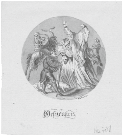
Abb. 7: Jacob Grimm, Gespenster, vermutlich zwischen 1800–1802, Federzeichnung

Unter den vorliegenden Motivgruppen nimmt das undatierte Blatt „Gespenster“ von Jacob Grimm eine Sonderstellung ein (vgl. Abb. 7). Es dürfte zwischen 1800 und 1802 entstanden sein. Es belegt zum einen die zunehmende Begeisterung für Grusel- und Gespenstergeschichten zu Beginn des 19. Jahrhunderts und orientiert sich sowohl in der Bildfassung als auch in der Beschriftung an einem zeitgenössischen Kupferstich. Es ist zugleich ein Hinweis auf das wachsende Interesse der Brüder an Sagen und deren Bildwelten, die Zeichnung ist dramatisch in Hell-Dunkel-Kontrasten formuliert. Das Motiv der wilden Gespensterjagd scheint sich auf eine