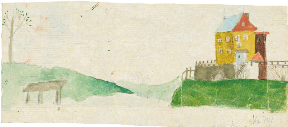
Abb. 6: Wilhelm Grimm (?), Landschaft bei Steinau mit Mühle und Brücke, vermutlich um 1795, kolorierte Zeichnung mit Muschelfarben © Hessisches Staatsarchiv Marburg, Bestand 340 Grimm, Nr. B 281.

So liegen hier bereits die ersten gemalten Reisebeschreibungen der Brüder vor, aus der Erinnerung gezeichnet und farbig ausgeschmückt. Manche Stellen bleiben auf den Blättern offen. Andere Details verweisen auf die kindliche Lust am Erzählen und Gestalten, Spontaneität und die Freude am Farbauftrag.