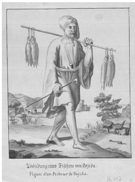
Abb. 3: Jacob Grimm, Ein Fischer von Dsjida ( Figure d'un Pêcheur de Dsjida ), um 1776/97, lavierte Federzeichnung in Grau

Eine lavierte Federzeichnung von Jacob Grimm aus den Jahren 1796/97, die Abbildung eines Fischers von Dsjida ( Figure d'un Pêcheur de Dsjida ), ist die exakte Kopie einer Kupferstichtafel aus Carstens Niebuhrs „Reisebeschreibung nach Arabien und anderen umliegenden Ländern“, Band 1, erschienen 1774. 3 Das Werk beschreibt die intensive Aneignung von Wissen, das Abenteuer und den forschenden Blick in eine fremde Welt, an der Jacob durch seine Zeichnung teilhat (vgl. Abb. 3). Es geht um Bildung durch Bilder und Anschauung, um die Aufnahme von Lehrtafeln und ihren Informationen. Aus einem weiteren, bisher nicht identifizierten Buch stammt das Motiv des Neuseeländers (vgl. Abb. 1 und 2). Hier finden sich zwei ebenfalls lavierte Federzeichnungen der Brüder im Stil der Niebuhr-Illustrationen, die mit der Widmung an das gleiche Vorbild sehr wahrscheinlich an einem Tisch und zur gleichen Zeit nebeneinander entstanden sind.