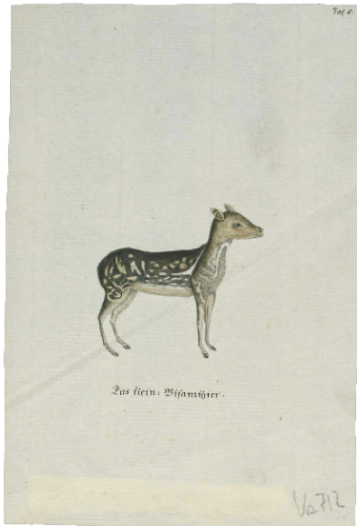
Abb. 1: Vermutlich Wilhelm Grimm (durch Schriftvergleich), ‚Das kleine Bisamthier‘, um 1796/97 (?), kolorierte Zeichnung