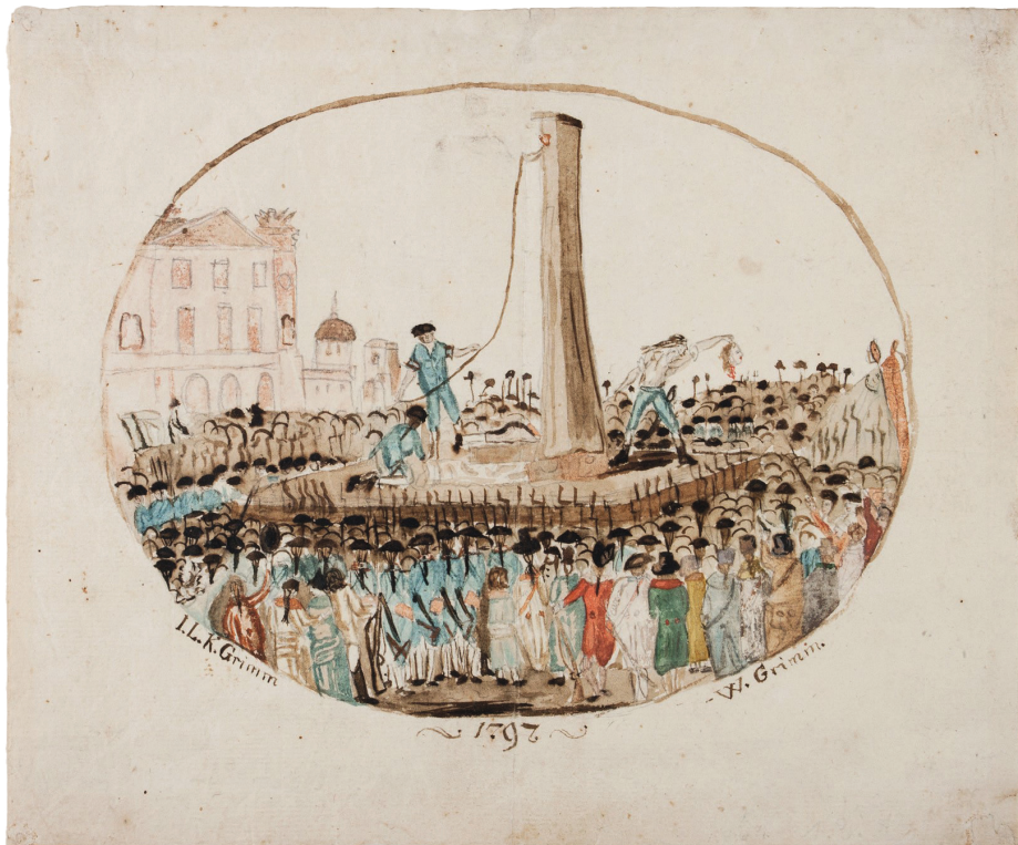
Abb. 4: Gemeinsames Werk von Jacob (J.L.K.) Grimm und Wilhelm Grimm, Enthauptung von Ludwig XVI. in Paris im Jahr 1793, 1797, kolorierte Zeichnung © Bad Homburg, Verwaltung der Staatlichen Schlösser und Gärten Hessen, Inv. Nr. 1.3.130. Gemeinfrei.