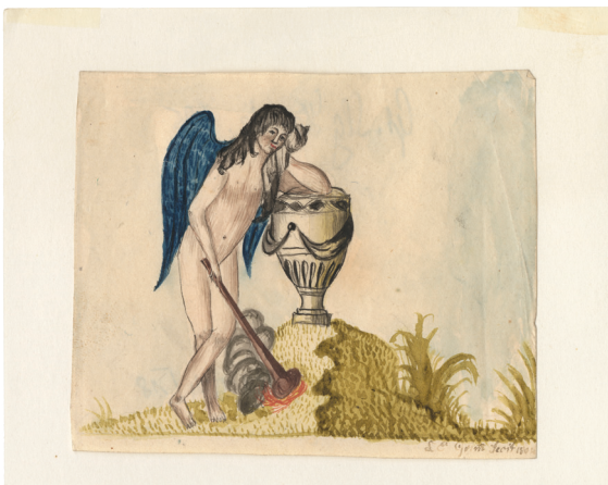
Abb. 3: Ludwig Emil Grimm, Trauernder Genius mit gesenkter Fackel, sich an eine Urne lehndend, 1804, Feder in Schwarz, aquarelliert auf hellem Papier. Blattgröße 8,1 × 9,8 cm © Grimm-Sammlung der Stadt Kassel, Hz. 605.