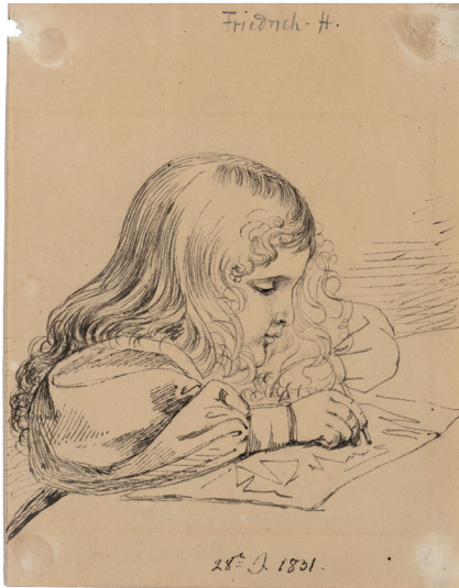
Abb. 4: Ludwig Emil Grimm, Der dreijährige Friedrich Hassenpflug beim Zeichnen, 1831 © Grimm-Sammlung der Stadt Kassel, Hz. 604.