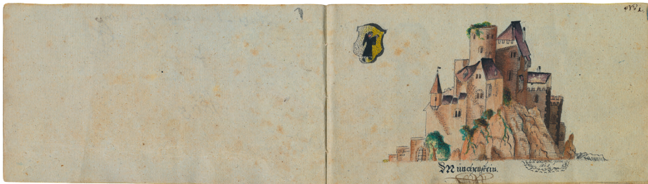
Abb. 3: Ludwig Emil Grimm, Skizzenbuch, 1805, S. 4