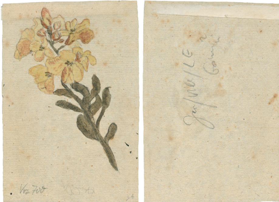
Abb. 1: Jacob, Wilhelm oder Ludwig Emil Grimm, [Löwenmäulchen], [um 1800], kolorierte Zeichnung, 12,0 × 8,1 cm, Nachlass Grimm (340 Grimm)

zur Vollendung der Jugendzeit (18. Lebensjahr) der Grimm-Kinder fort (Dorothea Hassenpflug und Friederike Grimm, 1851) lassen sich aufgrund des zeichnerischen Könnens und der thematischen Ausrichtung ca. 20 Zeichnungen aus den Jugendjahren von Ludwig Emil, Jacob und/oder Wilhelm Grimm ausmachen. Eine klare Zuordnung der Werke zu ihrem jeweiligen Zeichner ist nicht immer gegeben und entsprechend auf den Werken mit beispielsweise „Jacob, Wilhelm oder Ludwig Emil Grimm“ vermerkt (Abb. 1).