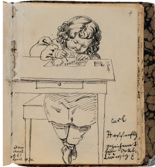
Abb. 5: Ludwig Emil Grimm, Carl Hassenpflug („Carl Hassenpflug gezeichnet beim Onkel Ludwig E“), 6. April 1830, Skizzenbuch © Grimm-Sammlung der Stadt Kassel, Hz. 767 [32r.