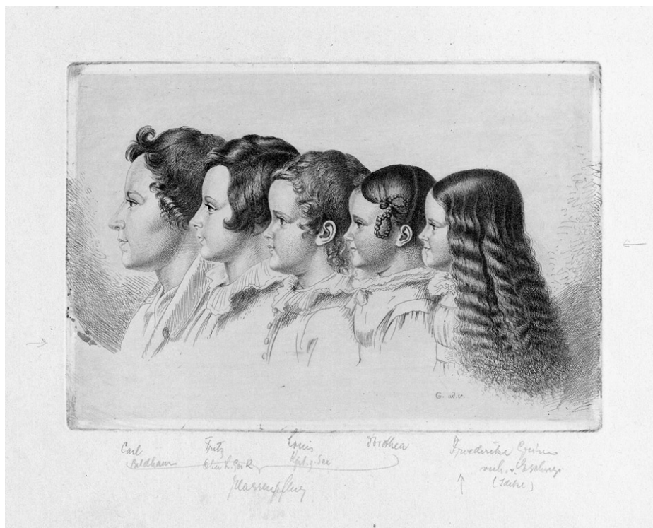
Abb. 1: Ludwig Emil Grimm, Die vier Kinder von Lotte Hassenpflug (geb. Grimm), ganz rechts Ideke, die Tochter von Ludwig Emil Grimm, um 1838, Radierung. Gemeinfrei.