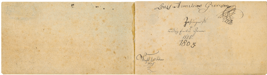
Abb. 2: Ludwig Emil Grimm, Skizzenbuch, 1805, S. 2