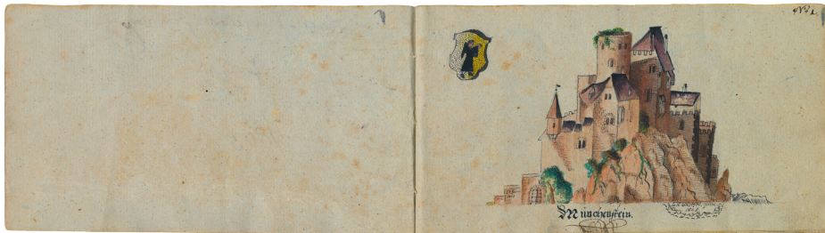
Abb. 3: Ludwig Emil Grimm, Skizzenbuch, 1805, S. 4