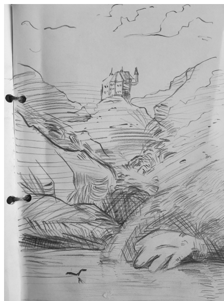
Abb. 4: Kinderzeichnung einer 13-jährigen Schülerin, nach Vorlage der Grimmschen Kinderzeichnungen (vgl. oben), Kohle und Bleistift auf Papier, Format DIN A5, entstanden im Rahmen der Museumskoffer-AG am Ferdinand Franz Wallraf Gymnasium in Köln für den Museumskoffer zu dem Thema „Märchen – Geschichten der Brüder Grimm und Zeichnungen der „Grimmschen Kinder““ (siehe Abb. 8–10).

Technisch interessant für die Verwendung der Grafik im Kunstunterricht sind vor allem die Varianz der Schraffur, zu sehen in den Abbildungen 1–4 in den Techniken Tiefdruck und Zeichnung (Abb. 2, 3 und 4). Hier können die Kinder unterschiedliche Schraffuren anhand der Bildbeispiele ausprobieren und üben, indem sie Vorlagen abzeichnen, was zumeist auf große Begeisterung in den Erfolgen trifft und auf eigene