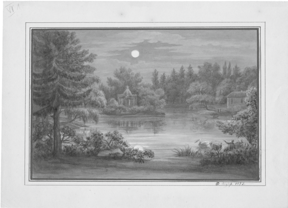
Abb. 1: Friederike Grimm, See im Mondschein [der Aueteich in Kassel?], auf einer Bank am Ufer ein Paar, auf dem Wasser ein Schwan, 1852, Aquarell auf hellem Papier © Grimm-Sammlung der Stadt Kassel, Hz. 802.

Die bildnerischen Fähigkeiten korrelieren neben einer Familienbegabung mit den historischen Vorzeichen der Unmittelbarkeit und Regelmäßigkeit der Naturerfahrung, Kunstrezeption sowie den Maximen eines Zeichenunterrichtes, der, wie wir im historischen Überblick gesehen haben, die Mimesis als Grundlage und die Erweiterung durch die Vorstellungskraft in dem Geniekult um die kindliche Weltsicht in der Imagination sieht. Von dieser historischen Idee lässt sich auch im heutigen Kunstunterricht wieder Gebrauch machen, keineswegs in einer Rückwendung, eher in einer Verbindung des sich in exzessivem Computerspielens zeigenden Bedürfnis nach Weltflucht und der Verbindung mit ästhetischen Fertigkeiten.