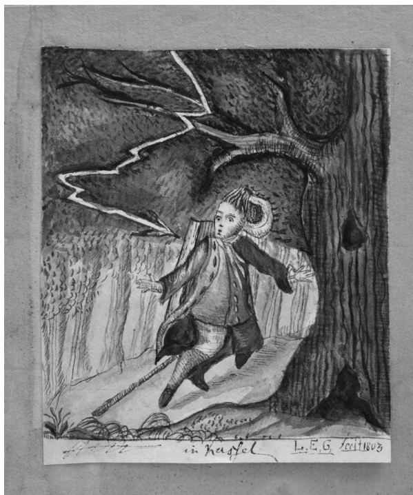
Abb. 5: Ludwig Emil Grimm, Junger Mann unter einem Baum vom Blitz getroffen, 1803, Feder und Pinsel in Grau auf hellem Papier © Grimm-Sammlung der Stadt Kassel, Hz. 4.