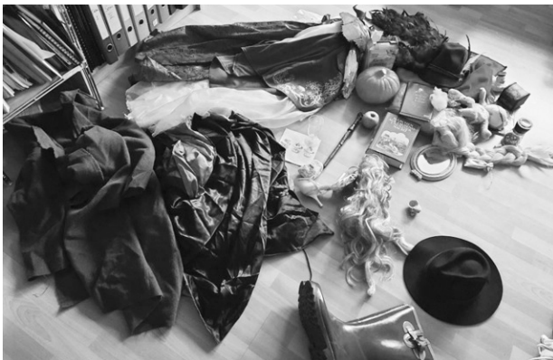
Abb. 11: Ergänzende Gegenstände für einen Kostüm- und Requisitenkoffer zum Märchenkoffer für die theaterpraktische Methodik.