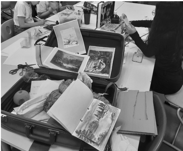
Abb. 8–10: Museumskoffer zum Thema „Märchen – Geschichten der Gebrüder Grimm und Zeichnungen der ‚Grimm-Kinder‘“ für das fächerübergreifende Lernen in den Fächern Deutsch und Kunst für die 5. und 6. Jahrgangsstufe als Endprodukt und während der Entstehung in der Museumskoffer-AG am Ferdinand Franz Wallraf Gymnasium in Köln, 2022.