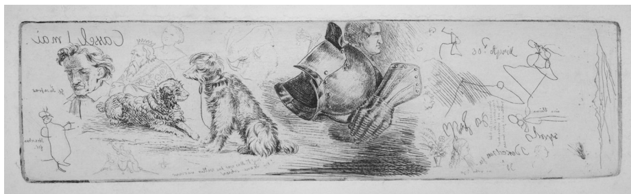
Abb. 2: Ludwig Emil Grimm, Entwurf mit dem Helm und Eisenhandschuh, o. J., Radierung © Grimm-Sammlung der Stadt Kassel, Graph. 236.