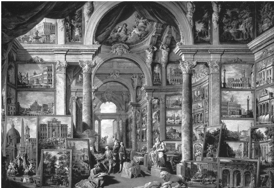
Abb. 4: Giovanni Paolo Panini, Roma moderna, um 1755, Boston, Museum of Fine Arts, aus: Katalog der Ausstellung „Roma antica“, Dortmund 1994, München 1994, S. 109.