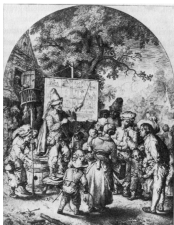
Abb. 8: Christian Wilhelm Ernst Dietrich, Die Bänkelsänger, um 1740, Radierung.