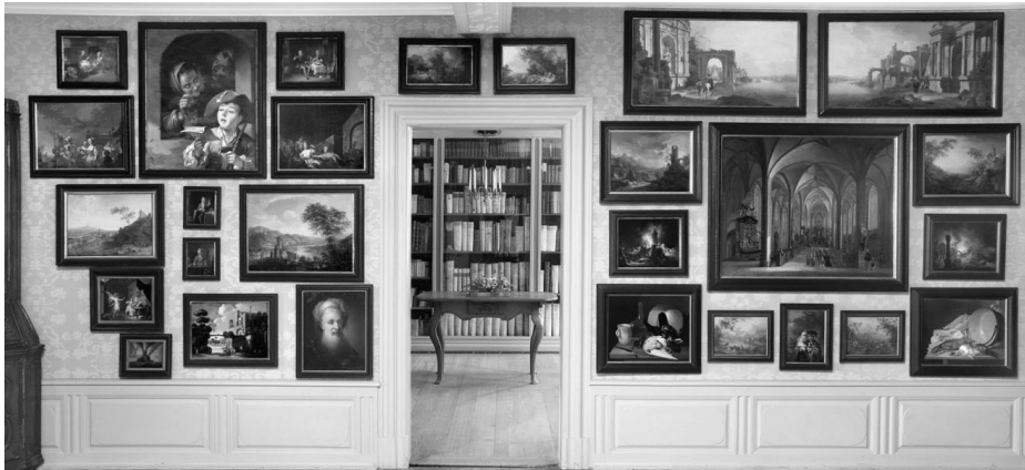
Abb. 3: Rekonstruktion der Hängung der Bilder in Goethes Geburtshaus nach 1756, Frankfurt/M., Goethe-Haus.