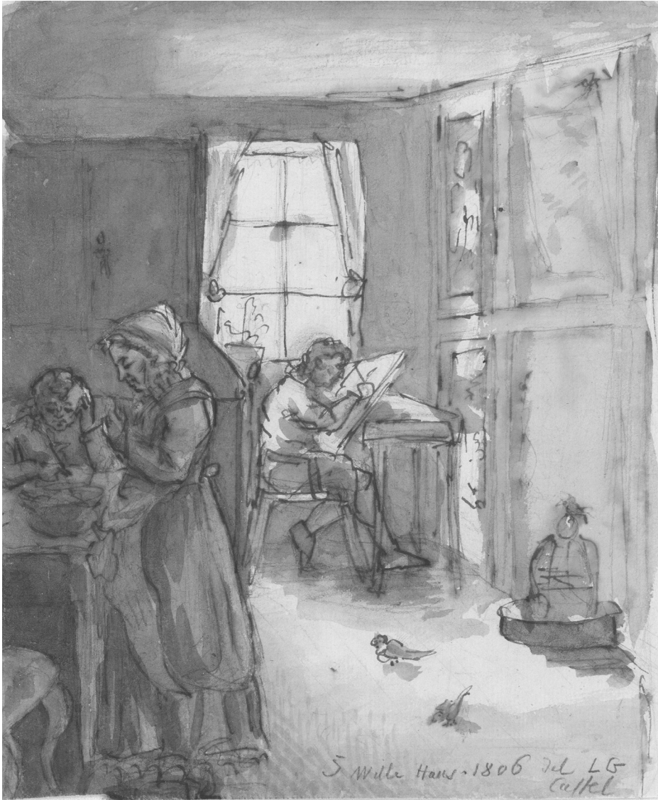
Abb. 1.: Ludwig Emil Grimm: Zeichnender Junge (Detail), 1806, Feder und Pinsel über Bleistift © Grimm-Sammlung der Stadt Kassel, Hz. 745.