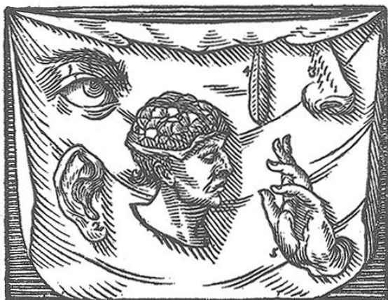
Abb. 10: Comenius, Darstellung des Gehirns, „Orbis sensualium pictus“, Taf. 49 (Sensûs externi et interni / Euserliche und innerliche Sinnen), 1658.