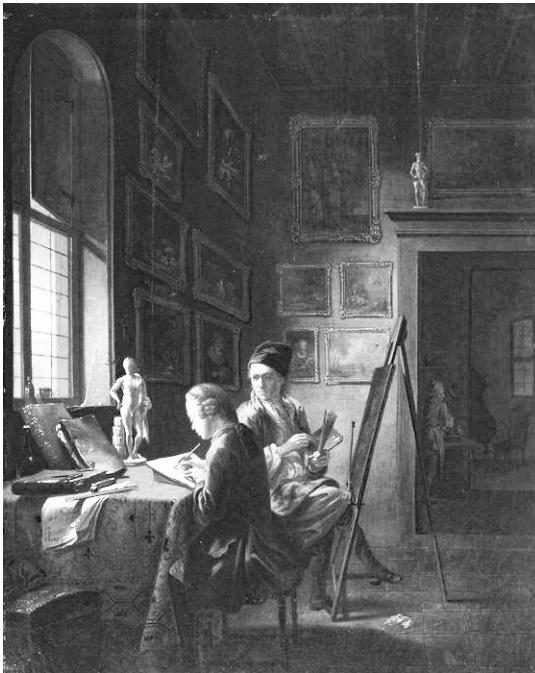
Abb. 2: Julius Juncker: Zeichenunterricht, 1752, Kassel, Staatliche Kunstsammlungen.

Eine der Schilderung Goethes verwandte Szene stellt der damals in Frankfurt bekannte Maler Julius Juncker 1752 dar, der sich selbst in der Bildmitte an einer Staffelei zeigt und zugleich die entstehende Zeichnung eines Schülers betrachtet. Der Junge sitzt am Fenster am linken Bildrand und kopiert eine vor ihm stehende Statuette, die Nachbildung einer Statue des Antinoos im Vatikan. 6