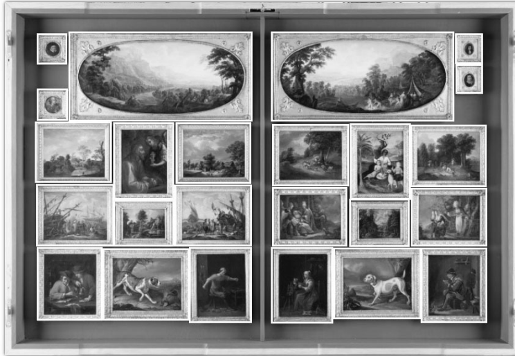
Abb. 6: Miniaturgalerie des Johann Valentin Prehn, 3. Abteilung, nach 1780, Frankfurt/M. Historisches Museum.

Gemälde und vor allem ein Miniaturkabinett mit 812 Bildern in seinem Haus präsentierte. 15 Die Miniaturen rezipieren Gemälde flämische und niederländische Gemälde des 17. Jahrhunderts, deutsche Werke der Gegenwart und insbesondere auch zahlreiche Arbeiten aus der zeitgenössischen Frankfurter Kunstszene.