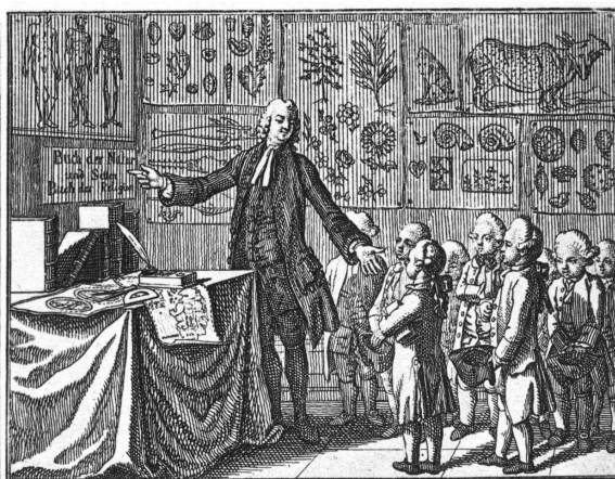
Abb. 9: Daniel Chodowiecki, Der Unterricht der Kinder, 1774, aus: Bernhard Basedow, „Elementarwerk“.

In der alltäglichen Bilderwelt der Brüder Grimm gab es mehrere bedeutende Komplexe, in denen Bilder und die mit ihnen verbundene Generierung von Wissen eine zentrale Rolle spielten: Weit verbreitet waren in der 2. Hälfte des 18. Jahrhunderts