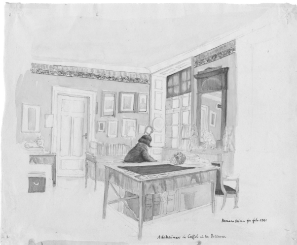
Abb. 7: Herman Grimm, Wilhelm Grimm in seinem Arbeitszimmer, 1841 © Grimm-Sammlung der Stadt Kassel, Hz. 855.

Das Haus Grimm folgte offenbar diesem Trend der Präsentation von Bildern – ein später Reflex zeigt sich in einer Zeichnung Herman Grimms, die seinen Vater 1841 in dessen Kasseler Arbeitszimmer zeigt: Die Wände Raumes sind mit Bildern bedeckt, dazu Bücher, vor allem umfangreiche Folianten.