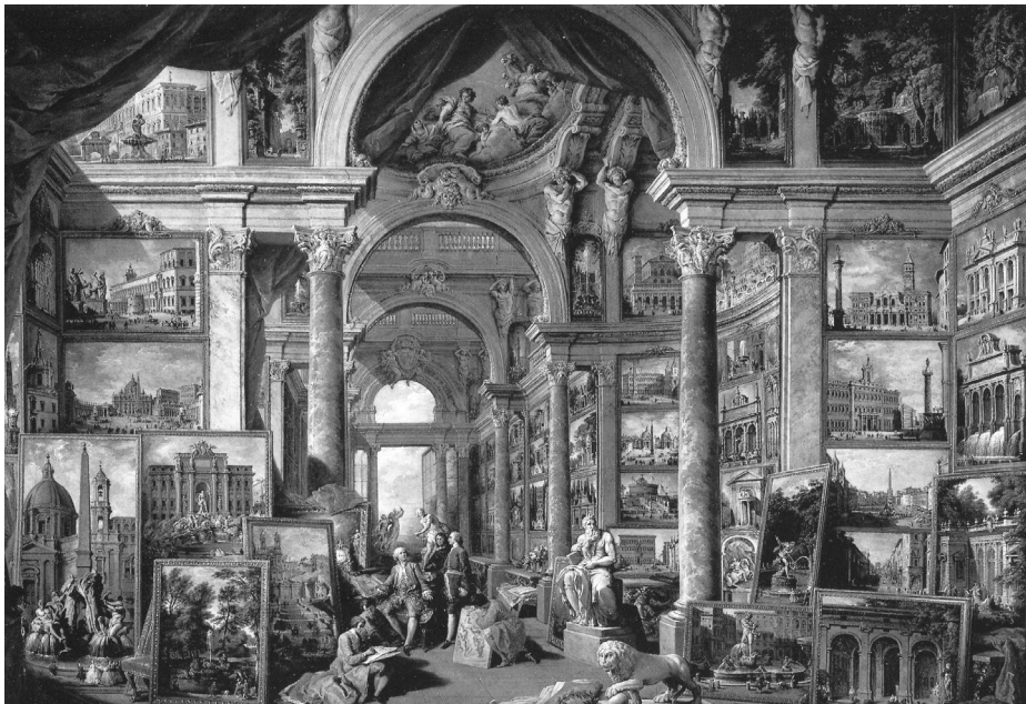
Abb. 4: Giovanni Paolo Panini, Roma moderna, um 1755, Boston, Museum of Fine Arts, aus: Katalog der Ausstellung „Roma antica“, Dortmund 1994, München 1994, S. 109.

Mit der symmetrischen Hängung folgte Johann Caspar Goethe dem Trend seiner Zeit und rezipierte die Anordnung von Gemälden in den Repräsentationsräumen des Adels. Als prominentes Beispiel sei die von Giovanni Paolo Panini um 1755 für den Grafen Etienne-François de Stainville konzipierte imaginäre Gemäldegalerie mit der Gegenüberstellung von Ansichten des antiken und des zeitgenössischen Rom.