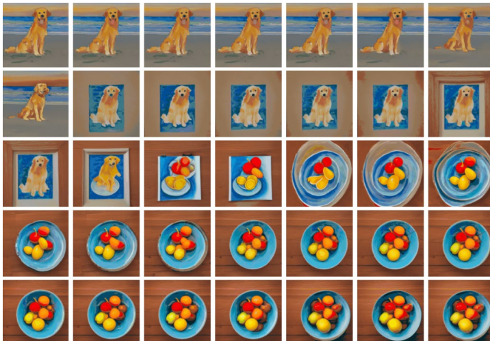
Abbildung 7: latent space zwischen zwei prompts bei Stable Diffusion 250

Beim Blick auf die grafische Auffächerung dieses – im Vergleich zum gesamten Vektorraum des KI-Modells von Stable Diffusion – verschwindend kleinen Linienabschnitts im latent space wird deutlich, dass das Modell eine nahezu unendliche Anzahl von Ausdrucksdaten in zahlreichen Dimensionen „gelistet“ haben muss. Lediglich zur Klarstellung muss dabei darauf hingewiesen werden, dass die Ordnung – d.h. die Reihenfolge der Bestandteile – nach einem um ein Vielfaches komplexeren System erfolgt als der einfachen Ausrichtung an semantischen Inhalten wie etwa „Hund am Strand“, „Hund mit blauem Hintergrund“ oder „Hund mit blauem Hintergrund, der die Pfote hebt“ und so weiter. Der latent space des Modells präsentiert sich vielmehr als umfassende Kartographierung der Ausdrucksdaten nach sämtlichen für die Dimensionen des Modells relevanten Informationen und deshalb auch entlang einer vielfach vektorisierten qualitativen „Landschaft“ der verschiedenen, dem Modell „antrainierten“ Ausdruckselemente.