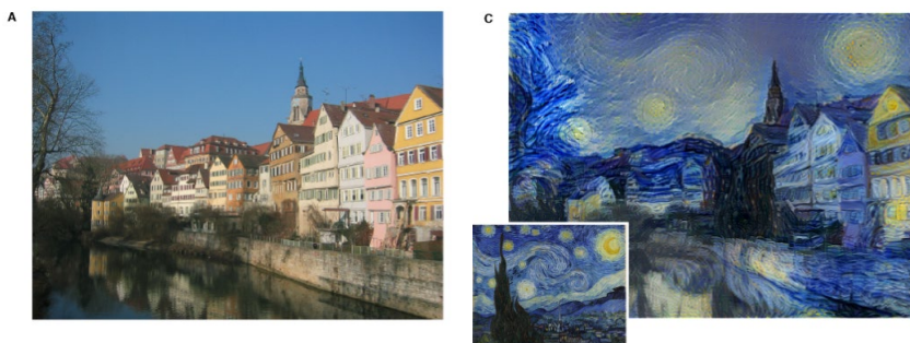
Abbildung 6: Fotografie der „Tübinger Neckarfront“ und der „Sternennacht“ (klein), mit KI-generierter „sternennächtlicher Tübinger Neckarfront“ 243

Hinsichtlich der Ergebnisse entspricht dies (trotz abweichender technischer Grundlage) der Extraktion von Ausdruckselementen aus literarischen Werken durch das KI-Modell in der „Smart Reply“-Anwendung Googles. Das Modell im Beispiel von Gatys et al. wurde zwar nicht im eigentlichen Sinne mit den Daten aus van Goghs Oeuvre „trainiert“. Die internen Repräsentationen des Klassifikator-KNNs konnten den besonderen Stil des Malers aber auch ohne umfassendes Training replizieren. Die technische Trennung und Unterscheidung der Inhalts- und der Stilebene belegt dabei bereits für diesen Ansatz, dass Syntax-Bestandteile auch bei einfachen Formen von Klassifikator-KNNs übernommen und repliziert werden können. Für die im Vergleich zum Beispiel von Gatys et al. weiterentwickelte KI-Technologie der mit großen Datenbeständen und deren Syntaxbestandteilen trainierten generativen Modelle – Stichwort: „ copy expression for expression's sake “ – ist deshalb auch unbestreitbar, dass sich Repräsentation und Replikation nicht auf die Semantik der Trainingsinhalte beschränken. Von einem Aussieben der Syntax und deren Nichtberücksichtigung im Trainingsprozess kann daher keine Rede sein.