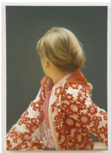
Abbildung 1: Betty, Gerhard Richter, 1991

der Farbpunkte auf genau diese Art und Weise auch festgelegt, um welche Art Baum es sich handelt, zu welcher Jahreszeit er abgebildet ist, welches Alter er haben könnte – er wird zu einem einmaligen und wiedererkennbaren Bild eines Baumes, der womöglich ein analoges Vorbild hat, jedoch nicht derselbe ist und sein kann. So wird eine eigene Welt der Bildlichkeit und damit Sprache geschaffen, die ebenso wirklich ist, wie das, was wir als Realität verstehen. Der Begriff der Realität als Bezeichnung dessen, was wir als analoge Welt kennen, reicht zur Abgrenzung von der durch Zeichen rekonstruierten Welt nicht aus, ist doch auch diese Welt real mit einem eigenen Bedeutungshorizont. So geht selbst das wie eine Fotografie anmutende Gemälde „Betty“ des Künstlers Gerhard Richter 1 schon allein dadurch, dass es keine Fotografie ist, über die reine Zeichenhaftigkeit der Abbildung einer blonden Frau in rot-geblühter Kapuzenjacke, die über ihre Schulter zurückblickt, hinaus und eröffnet nur durch die Art der Nutzung von Bildpunkten zur Darstellung eine Aussagekraft und einen Kommunikationsinhalt, eine Botschaft. Diese geht über die Botschaft hinaus bzw. ist eine andere, würden wir die analoge Betty in dieser Pose in einem situativen analogen Setting eingebettet sehen.