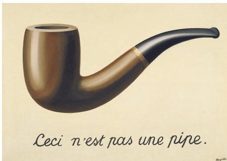
Abbildung 3: La trahison des images , René Magritte, 1929

Doch Bilder erweitern unsere Weltsicht nicht durch die Verdoppelung der Wirklichkeit, also dadurch, dass die Welt durch ihre Fragmentierung in Kleinstelemente und Reorganisation dieser zu einem neuen Ganzen wird. Durch Abbildung wird es auch möglich, Gedanken, Ideen und Vorgänge, die in der analogen Welt nicht materiell, sondern nur als Ideen oder Phantasmen existieren, real werden zu lassen. Als eines der vielen Beispiele kann hier Eschers „Waterfal“ 2 dienen; die Vision eines in sich geschlossenen Wasserkreislaufs, der sich immer wieder selbst antreibt, bei genauer Betrachtung jedoch ein Perpetuum mobile darstellt. Auch wenn das Abgebildete in der vormals existenten Welt so kein materielles Pendant hat, bekommt die Idee durch die bildliche Darstellung nun Materialität, wodurch die Welt selbst erweitert wird. Heißt also: Bilder sind nicht Teile der Welt, sie werden es. Sie verweisen auf Teile der analogen Realität, schaffen damit durch diese Rekurrenz auf die analoge Bezugsquelle für den Betrachter die Möglichkeit, die neue Botschaft verstehen zu können. Besonders deutlich macht das René Magrittes Abbildung einer Pfeife 3 , die keine Pfeife ist, da sie nicht die Eigenschaften der analogen Pfeife hat.