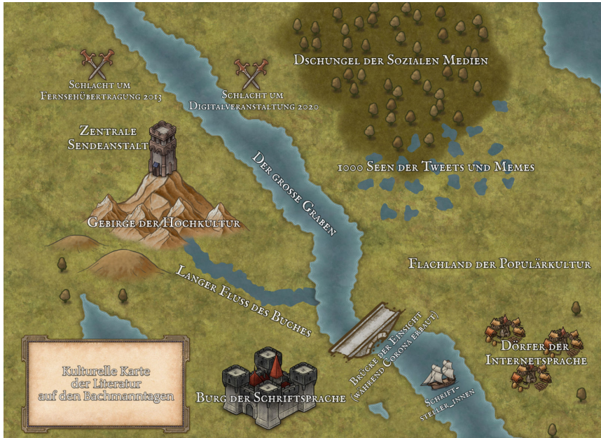
Abbildung 3: Kulturelle Karte von Literatur auf den Bachmannantagen. Objekte und Beschriftungen auf der Karte entsprechen den Selbst- und Fremdbezeichnungen der Akteure.

Die kulturelle Karte von Literatur, wie sie auf den Bachmannantagen hergestellt wird, ist in stetiger Veränderung. Durch die Hinzunahme von zunächst der Fernsehübertragung, später dem Livestream und den Angeboten auf sozialen Medien sind immer neue Konfliktfelder geschaffen worden, auf denen sich Akteure gegeneinander abgegrenzt, aber auch immer wieder Brücken gebaut haben. Demnach entspringt Literatur weder einem platonischen Ideenhimmel noch aus der Hochkultur selbst, sondern ist immer wieder Produkt von neuen Aus- und Eingrenzungen. Folglich ist die kulturelle Karte von Abbildung 3 eine Momentaufnahme, die in einigen Jahren anders aussehen wird. Darüber hinaus gibt es weitere Verbindungen und Konfliktlinien, die momentan aber nicht so zentral erscheinen wie die kommunizierte Opposition von Digitalkultur und Literatur.