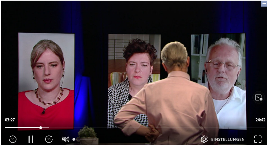
Abbildung 2: Nutzung von Split Screen in der Online-Übertragung der TddL 2020, Quelle: bachmannpreis.orf.at.

zu spät mit den großen Studiokameras wie in so manchen Jahr zuvor. 3 Dadurch wurde die „Lebendigkeit der Übertragung“ (Interview02) gesteigert, wie eine Person vom ORF im Interview sagte.