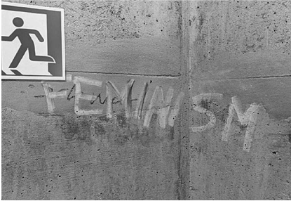
Abb. 10: UHG, Treppenturm D, Ebene 2.

Treppentürmen auf den zwei bis drei Ebenen ober- und unterhalb der Haupthalle sowie im jeweils obersten Stockwerk direkt unter dem Dach verortet sind. Hinzu kamen die an die Halle angrenzenden Flure und Treppenaufgänge und nicht zuletzt die Haupthalle selbst, die teilweise eine beträchtliche Dichte nicht nur an Graffitis, sondern gerade auch an Stickern aufweist. Angesichts der engen Zeitplanung ließ ich bald die sich als wenig ertragreich herausstellenden Bürokorridore in den oberen Etagen aus.