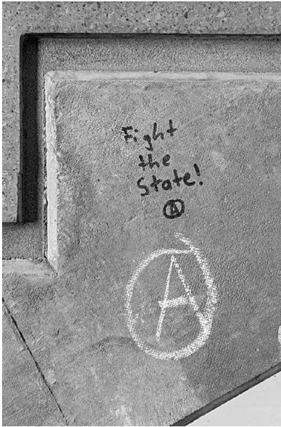
Abb. 8: UHG, Treppenturm BLC, Ebene 4.

Symbolen. (Letzteres fehlt interessanterweise bei den Stickern beinahe völlig, was aktivere Praktiken des Entfernens und Überklebens vermuten lässt.) Von besonderem Interesse für mein Projekt waren dabei solche Graffiti, die nachträgliche Veränderungen und Hinzufügungen, sprich eine (konfliktvolle) Interaktion zwischen unterschiedlichen Autor*innen, aufweisen (Graffiti-Beispiele: Abb. 7 bis 11).