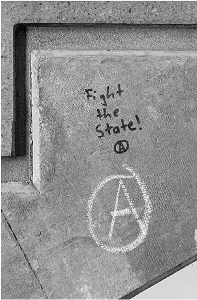
Abb. 8: UHG, Treppenturm BLC, Ebene 4.

Symbolen. (Letzteres fehlt interessanterweise bei den Stickern beinahe völlig, was aktivere Praktiken des Entfernens und Überklebens vermuten lässt.) Von besonderem Interesse für mein Projekt waren dabei solche Graffiti, die nachträgliche Veränderungen und Hinzufügungen, sprich eine (konflikthafte) Interaktion zwischen unterschiedlichen Autor*innen, aufweisen (Graffiti-Beispiele: Abb. 7 bis 11).