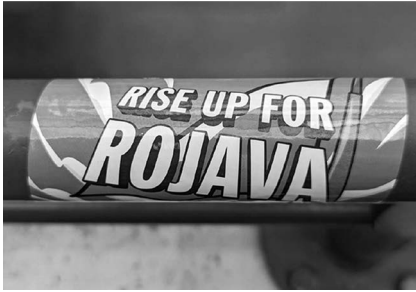
Abb. 5: UHG, Haupthalle, Galerie D1.

Platz im Studienalltag findet. Explizit verstanden als Leseweche , soll sie Freiheiten ermöglichen, Interessen jenseits der planmäßigen Studieninhalte zu verfolgen. Außerdem können nicht nur Lehrende, sondern auch Studierende Vorschläge für Veranstaltungen machen, die dann in dieser Woche stattfinden können.