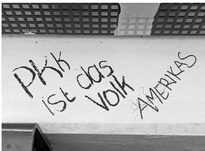
Abb. 9: UHG, Haupthalle, Galerie C1.

Symbolen. (Letzteres fehlt interessanterweise bei den Stickern beinahe völlig, was aktivere Praktiken des Entfernens und Überklebens vermuten lässt.) Von besonderem Interesse für mein Projekt waren dabei solche Graffiti, die nachträgliche Veränderungen und Hinzufügungen, sprich eine (konflikthafte) Interaktion zwischen unterschiedlichen Autor*innen, aufweisen (Graffiti-Beispiele: Abb. 7 bis 11).