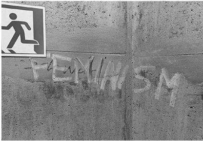
Abb. 10: UHG, Treppenturm D, Ebene 2.

Treppentürmen auf den zwei bis drei Ebenen ober- und unterhalb der Haupthalle sowie im jeweils obersten Stockwerk direkt unter dem Dach verortet sind. Hinzu kamen die an die Halle angrenzenden Flure und Treppenaufgänge und nicht zuletzt die Haupthalle selbst, die teilweise eine beträchtliche Dichte nicht nur an Graffiti, sondern gerade auch an Stickern aufweist. Angesichts der engen Zeitplanung ließ ich bald die sich als wenig ertragreich herausstellenden Bürokorridore in den oberen Etagen aus.