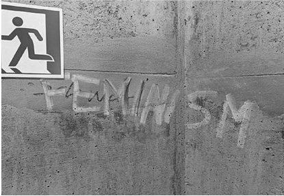
Abb. 10: UHG, Treppenturm D, Ebene 2.

Treppentürmen auf den zwei bis drei Ebenen ober- und unterhalb der Haupthalle sowie im jeweils obersten Stockwerk direkt unter dem Dach verortet sind. Hinzu kamen die an die Halle angrenzenden Flure und Treppenaufgänge und nicht zuletzt die Haupthalle selbst, die teilweise eine beträchtliche Dichte nicht nur an Graffiti, sondern gerade auch an Stickern aufweist. Angesichts der engen Zeitplanung ließ ich bald die sich als wenig ertragreich herausstellenden Bürokorridore in den oberen Etagen aus.