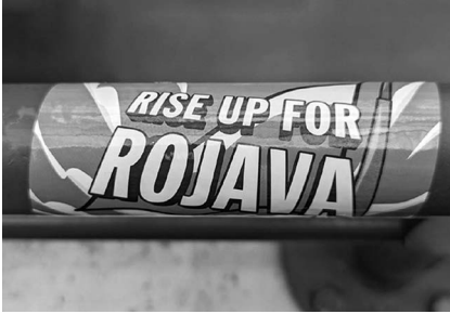
Abb. 5: UHG, Haupthalle, Galerie D1.

Platz im Studienalltag findet. Explizit verstanden als Leseweche , soll sie Freiheiten ermöglichen, Interessen jenseits der planmäßigen Studieninhalte zu verfolgen. Außerdem können nicht nur Lehrende, sondern auch Studierende Vorschläge für Veranstaltungen machen, die dann in dieser Woche stattfinden können.