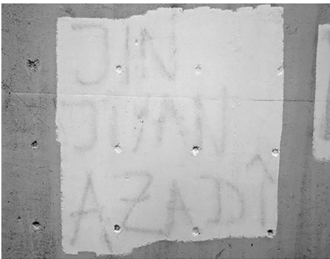
Abb. 3: Unter der Farbe erkennbares Graffiti an der Rampe neben dem Haupteingang des UHG.

Das Erstellen eines sol-chen Korpus an Fotografien von Graffitis und Stickern in den Gebäuden und auf dem Gelände der Universität Bielefeld beinhaltet schließlich einen dokumentarischen Aspekt. Insbesondere vor dem Hintergrund der fort-schreitenden Renovierungs-arbeiten am Hauptgebäude (UHG) ist absehbar, dass diese Ausdrücke des politi-schen Lebens an der Univer-sität nicht ewig erhalten blei-ben werden. Darüber hinaus ‚verschwinden‘ Graffitis und Sticker auch im alltäglichen Universitätsbetrieb, nicht zu-letzt aufgrund von Praktiken des aktiven Entfernens oder Zerstörens. Anschaulichstes Beispiel in dieser Hinsicht ist die Brücke, die den Haupt-eingang des UHG mit der Stadt-bahn-Haltestelle verbind-et. Auf deren wandartige Geländer geschriebene (ge-rade auch politische) Graffi-tis werden regelmäßig mit Farbe überstrichen und so unkenntlich gemacht