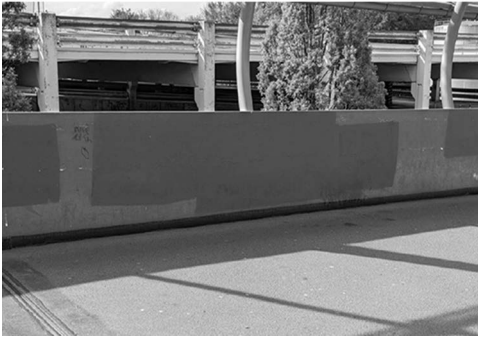
Abb. 2: Brückengeländer mit Flächen neuer Farbe, die u.a. „Jin, Jiyan, Azadi“-Graffitis aus dem vorangegangenen Semester überdecken.

im Sinne eines radikal-demokratischen Verständnisses, demzufolge solche Praktiken Demokratie überhaupt erst ausmachen (vgl. Flügel-Martinsen 2020: 123). Allerdings können Graffitis und Sticker auch explizit antide-mokratische, wie eben zum Beispiel rechtsextreme, Ausrichtungen auf-weisen. Nicht alle sich hier abzeichnenden Konflikte zwischen verschie-denen Ideen der Gestaltung gesellschaftlicher Ordnung und eventuell damit verbundenen politischen Projekten sind demnach per se als de-mokratisch einzustufen (vgl. ebd.: 108f.).