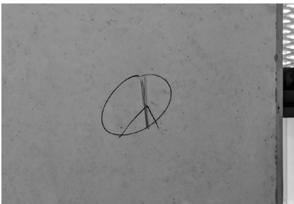
Abb. 1: Graffiti im Treppenhaus, X-E0.

In einem Treppenhaus im X-Gebäude der Universität Bielefeld findet sich ein auf den ersten Blick unscheinbares Graffiti, bestehend nur aus einem ungleichmäßig gezogenen Kreis und ein paar schiefen Strichen in dünner Linienführung. Erst eine genauere Betrachtung entschlüsselt das Motiv in Gänze: Auf eine Säule des Treppenaufgangs, auf halber Höhe zwischen Erdgeschoss und erstem Stock, hat jemand zuerst ein (leicht verzerrtes) stilisiertes Lambda-Schild – das Symbol der rechtsextremen „Identitären Bewegung“ – gezeichnet. Später wurde jedoch mit mehreren feineren Strichen ein senkrechter Balken durch die Spitze des \Lambda hinzugefügt, der das Logo der „IB“ zum Peace-Zeichen umwandelt (Abb. 1).