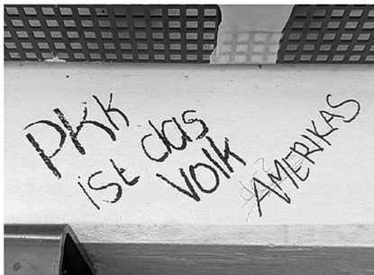
Abb. 9: UHG, Haupthalle, Galerie C1.

Symbolen. (Letzteres fehlt interessanterweise bei den Stickern beinahe völlig, was aktivere Praktiken des Entfernens und Überklebens vermuten lässt.) Von besonderem Interesse für mein Projekt waren dabei solche Graffiti, die nachträgliche Veränderungen und Hinzufügungen, sprich eine (konfliktvolle) Interaktion zwischen unterschiedlichen Autor*innen, aufweisen (Graffiti-Beispiele: Abb. 7 bis 11).