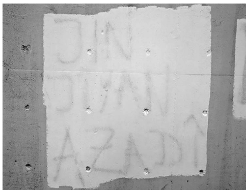
Abb. 3: Unter der Farbe erkennbares Graffiti an der Rampe neben dem Haupteingang des UHG.

Das Erstellen eines sol-chen Korpus an Fotografien von Graffitis und Stickern in den Gebäuden und auf dem Gelände der Universität Bielefeld beinhaltet schließlich einen dokumentarischen Aspekt. Insbesondere vor dem Hintergrund der fort-schreitenden Renovierungs-arbeiten am Hauptgebäude (UHG) ist absehbar, dass diese Ausdrücke des politi-schen Lebens an der Univer-sität nicht ewig erhalten blei-ben werden. Darüber hinaus ‚verschwinden‘ Graffitis und Sticker auch im alltäglichen Universitätsbetrieb, nicht zu-letzt aufgrund von Praktiken des aktiven Entfernens oder Zerstörens. Anschaulichstes Beispiel in dieser Hinsicht ist die Brücke, die den Haupt-eingang des UHG mit der Stadtbahn-Haltestelle verbind-et. Auf deren wandartige Geländer geschriebene (ge-rade auch politische) Graffi-tis werden regelmäßig mit Farbe überstrichen und so unkenntlich gemacht