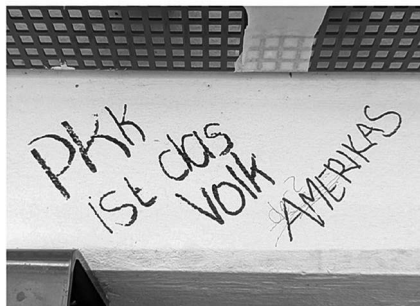
Abb. 9: UHG, Haupthalle, Galerie C1.

Symbolen. (Letzteres fehlt interessanterweise bei den Stickern beinahe völlig, was aktivere Praktiken des Entfernens und Überklebens vermuten lässt.) Von besonderem Interesse für mein Projekt waren dabei solche Graffiti, die nachträgliche Veränderungen und Hinzufügungen, sprich eine (konflikthafte) Interaktion zwischen unterschiedlichen Autor*innen, aufweisen (Graffiti-Beispiele: Abb. 7 bis 11).