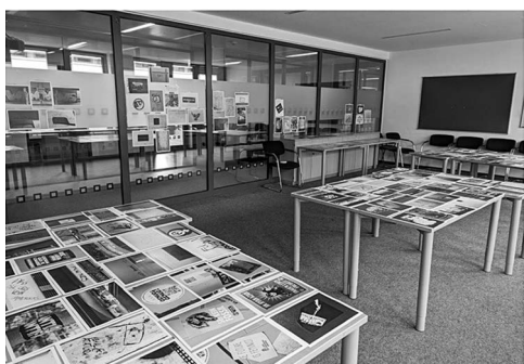
Abb. 14: Die Ausstellung am 30. Mai in X-B2-103.

dauerte bis weit nachdem die ersten Besucher*innen bereits eingetroffen waren. Mein Versuch, die Besucher*innen in das Verteilen der Drucke einzubinden, wurde nur mäßig angenommen. Da nach und nach Einzelne oder Zweier- oder Dreier-Grüppchen vorbeikamen, war nie viel Publikum gleichzeitig vor Ort. Das Aufkommen fächerte sich über beinahe den gesamten Ausstellungszeitraum auf, jedoch blieb die Anzahl der Besucher*innen insgesamt überschaubar. Die leicht abgelegene Lage des Raums machte sich in der geringen Menge der zufälligen Passant*innen bemerkbar. Für eine Veranstaltung der Lesewoche war die Ausstellung dennoch in der Summe sogar überdurchschnittlich gut besucht.