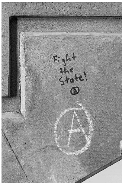
Abb. 8: UHG, Treppenturm BLC, Ebene 4.

Symbolen. (Letzteres fehlt interessanterweise bei den Stickern beinahe völlig, was aktivere Praktiken des Entfernens und Überklebens vermuten lässt.) Von besonderem Interesse für mein Projekt waren dabei solche Graffiti, die nachträgliche Veränderungen und Hinzufügungen, sprich eine (konflikthafte) Interaktion zwischen unterschiedlichen Autor*innen, aufweisen (Graffiti-Beispiele: Abb. 7 bis 11).