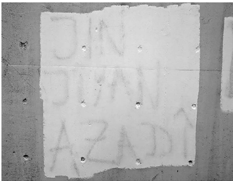
Abb. 3: Unter der Farbe erkennbares Graffiti an der Rampe neben dem Haupteingang des UHG.

Das Erstellen eines sol-chen Korpus an Fotografien von Graffitis und Stickern in den Gebäuden und auf dem Gelände der Universität Bielefeld beinhaltet schließlich einen dokumentarischen Aspekt. Insbesondere vor dem Hintergrund der fort-schreitenden Renovierungs-arbeiten am Hauptgebäude (UHG) ist absehbar, dass diese Ausdrücke des politi-schen Lebens an der Univer-sität nicht ewig erhalten blei-ben werden. Darüber hinaus ‚verschwinden‘ Graffitis und Sticker auch im alltäglichen Universitätsbetrieb, nicht zu-letzt aufgrund von Praktiken des aktiven Entfernens oder Zerstörens. Anschaulichstes Beispiel in dieser Hinsicht ist die Brücke, die den Haupt-eingang des UHG mit der Stadtbahn-Haltestelle verbind-et. Auf deren wandartige Geländer geschriebene (ge-rade auch politische) Graffi-tis werden regelmäßig mit Farbe überstrichen und so unkenntlich gemacht