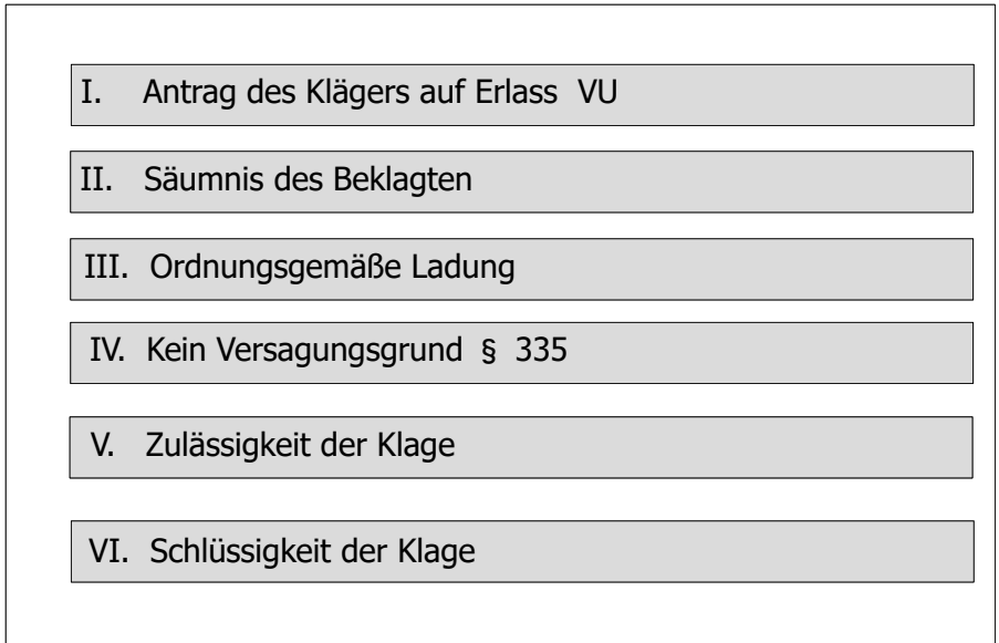
Abb. 37 Prüfungsschema VU gegen den Beklagten