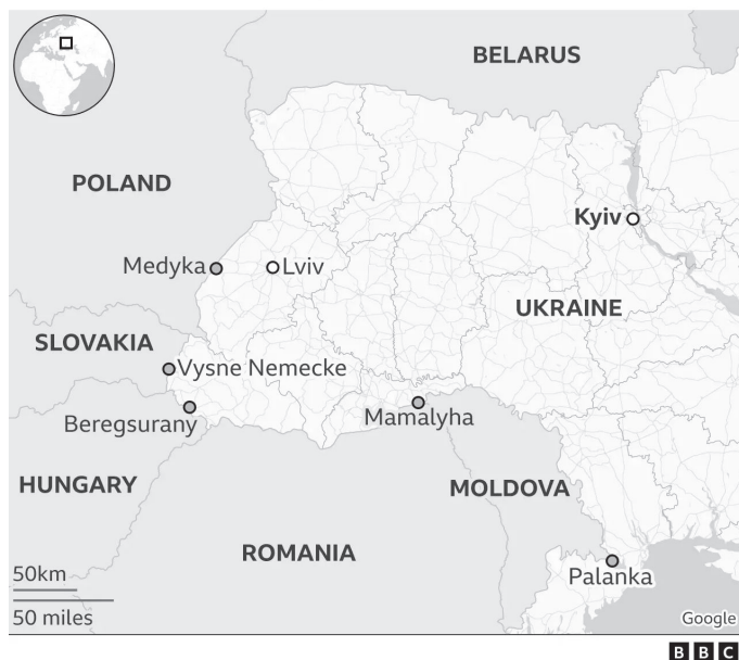
Abbildung 2: Einrichtungen an der ungarisch-ukrainischen Grenze. 10