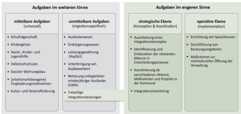
Abbildung 3: Aufgaben kommunaler Integrationsverwaltung

Quelle: Eigene Darstellung in Anlehnung an Bogumil et al. (2018: 74ff.) und Hafner (2019: 106ff.). Die Abbildung erhebt keinen Anspruch auf eine abschließende Aufzählung.