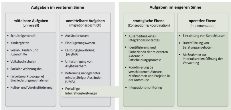
Abbildung 3: Aufgaben kommunaler Integrationsverwaltung

Quelle: Eigene Darstellung in Anlehnung an Bogumil et al. (2018: 74ff.) und Hafner (2019: 106ff.). Die Abbildung erhebt keinen Anspruch auf eine abschließende Aufzählung.