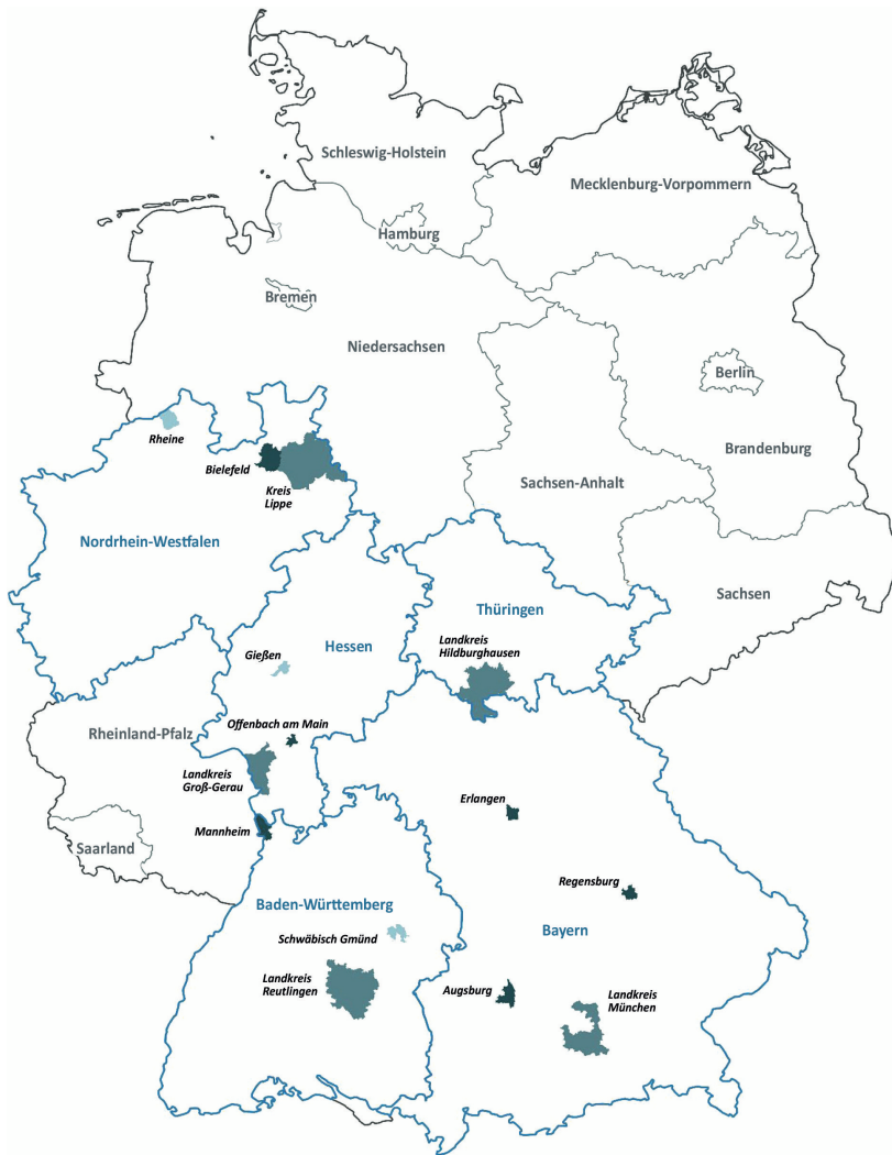
Abbildung 2: Geografische Darstellung der deutschen Fallkommunen

Quelle: Eigene Darstellung. Kartendaten: © GeoBasis-DE / BKG (2022), dl-de/by-2-0 ( https://www.govdata.de/dl-de/by-2-0 ), vz2500-001, vz250_0101-001.