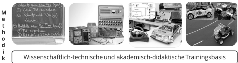
Abbildung 4: Veränderungen der Lern- und Lehrprozesse in der Telematik-ausbildung

Studiengänge gab es noch keine Telematik-Spezialisierung, sondern nur erste grundlegende Studienfächer der Elektrotechnik. Typische Lehrmittel waren Vorlesungen, Seminare und elektrische Simulationen. In den nächsten Jahrzehnten bis Anfang dieses Jahrhunderts wurden Kurse in einfacher grundlegender Telematik entwickelt, welche hier zum Beispiel erstmals durch digitale Simulationen ergänzt wurden. Mit Bezug zum Betrachtungsraum ab Anfang des jetzigen Jahrhunderts bis jetzt haben sich viele streng telematikbezogene Kurse etabliert, insbesondere für das vernetzte Fahren und der Umgebungserfassung sowie Datenfusion. Die moderne automobilen Ingenieurausbildung richtet sich daher derzeit anhand der neuen Forschungsherausforderungen beim autonomen Fahren aus. Das führt zu angepassten fachübergreifenden Wissensvermittlungsansätze wie Module aus der Mathematik (z.B. Data Mining), Informatik (z.B. Maschinelles Lernen) sowie aus der Fahrzeugtechnik (z.B. reale Feldtests mit Fahrzeugen). Dabei stellen die Praktika mit Livetests und eigener studentischer Datenbasis den substantiellen didaktischen Mehrwert dieser aktuellen Ausbildungsgeneration dar.