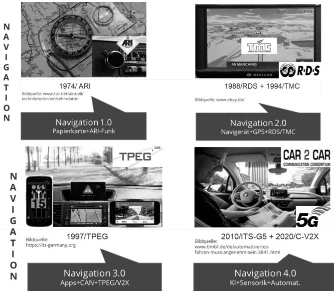
Abbildung 3: Zusammenfassende Übersicht zu den navigatorischen Revolutionsetappen