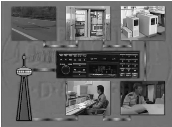
Abbildung 2: TMC-Meldungsfluss im Projekt „BEVEI“ mit Detektion durch Induktionsschleifen in der Fahrbahn sowie Datenübertragungen von Straßen- über Polizei-Behörden zur Rundfunkanstalt, die ebenfalls auf der Codierung von Events und Locations beruhen.