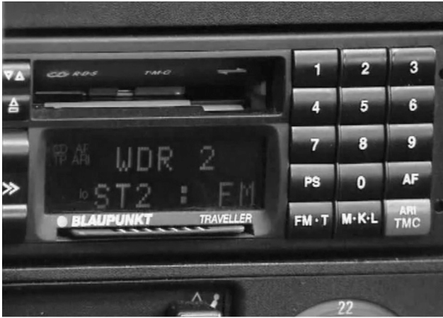
Abbildung 3: Ursprüngliches TMC-Autoradio zur Ausgabe der Meldungen in künstlicher Sprache (Screenshot aus WDR-PR-Film von 1994 zum Projekt „BEVEI“)

nen mit Hilfe synthetischer Sprache – damals als „Vocoder“ bezeichnet – in jeder gewünschten Sprache hörbar gemacht werden könnten. Abbildung 3 zeigt ein Autoradio, das TMC-Meldungen in künstlicher Sprache vorliest, wobei die Sprache mit Hilfe einer Einsteckkarte verändert werden kann.