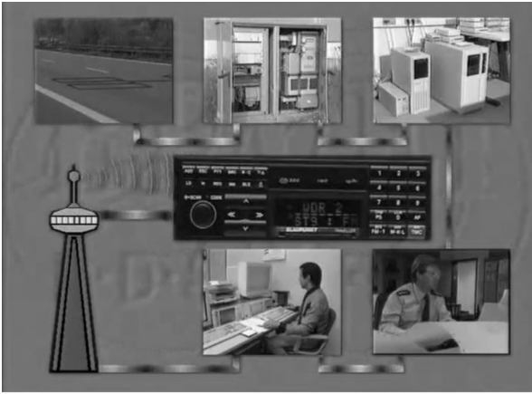
Abbildung 2: TMC-Meldungsfluss im Projekt „BEVEI“ mit Detektion durch Induktionsschleifen in der Fahrbahn sowie Datenübertragungen von Straßen- über Polizei-Behörden zur Rundfunkanstalt, die ebenfalls auf der Codierung von Events und Locations beruhen (Screenshot aus WDR-PR-Film zum Projekt von 1994).