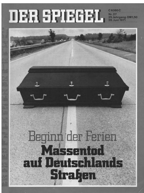
Abbildung 3: Titel Der Spiegel, 27/1971 vom 28.06.1971.

Massenmotorisierung in Form von immer mehr Toten und Verletzten sowie immensen volkswirtschaftlichen Schäden nun immer stärker in das öffentliche Bewusstsein drangen und skandalisiert wurden. „Das Gemetzel, das wir Verkehr nennen“, war 1971 eine Titelgeschichte des „Spiegel“ überschrieben, die weder an drastischen Formulierungen noch an entsprechenden Abbildungen sparte. 47