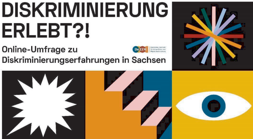
Abbildung 2 Werbebanner für die Betroffenenbefragung