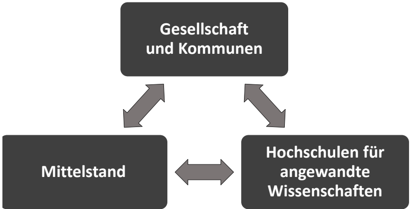
Abbildung 2: Regionale Innovationsökosysteme