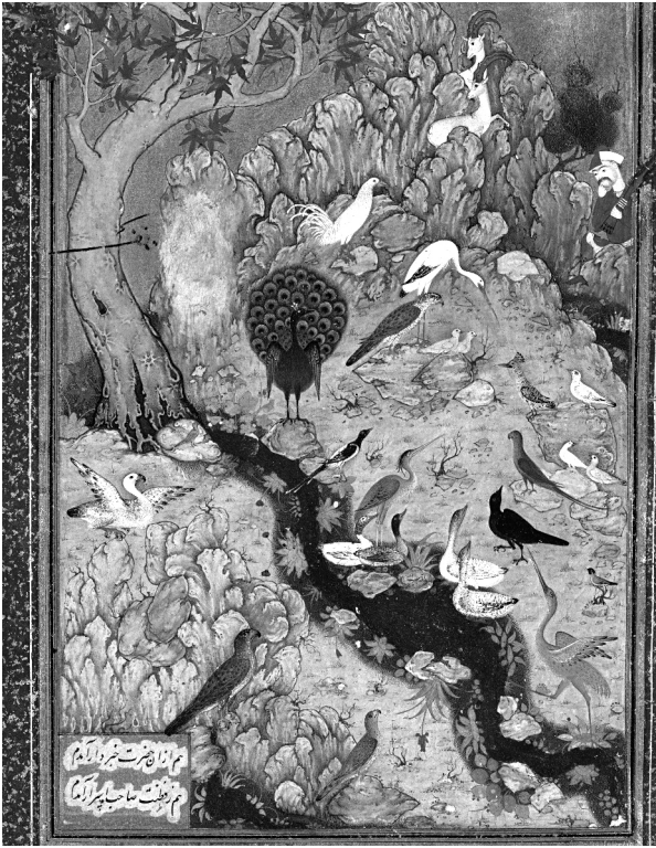
Abbildung: Illustration der „Vogelgespräche“ aus der Hand des persischen Künstlers Ḥabīb-allāh Savāji, um 1600. In der sufistischen und persischen literarischen Tradition war die Symbolisierung der mystischen Einsichten durch bildende Kunst geläufig. Bilder sollten den Text nicht nur schmücken oder veranschaulichen, sondern gewissermaßen selbst als spirituelle Medien die Botschaften des Texts gleichberechtigt transportieren. 6 Rechts mittig ist der Wiedehopf erkennbar, der den versammelten Vögeln vom Gottesvogel berichtet.

Die „Vogelgespräche“ schildern nun den Zug der Vögel durch sieben Täler in die Gegenwart des Simorgh. Auf der langen und beschwerlichen Reise geben die allermeisten Vögel auf oder sterben gar, bis schließlich nur mehr dreißig Vögel übrigbleiben. Hier nun stößt jeder Übersetzer der Geschichte auf ein unüberwindbares Hindernis: Im Persischen heißt es, nach ihrer erschöpfenden Reise erreichen dreißig Vögel den Gottesvogel Simorgh. Drei-