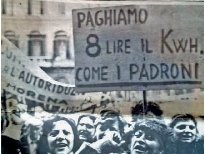
Abbildung 2: Autoriduzione-Proteste in Italien 6

Das Auftreten solcher Proteste in Frankreich, in Griechenland und anderen europäischen Ländern wurde bereits von Sozialwissenschaftlern der 1970er Jahre diagnostiziert: Die Konfrontation der Arbeitskämpfe erstreckte sich über die Fabrik hinaus und verweise auf umfassendere Auseinandersetzungen auch in der Konsumsphäre. 7 Hier wurde eine Verschiebung festgestellt, weg von einer klassischen, nicht zuletzt durch marxistische Einflüsse geprägten Perspektive auf die Arbeits- und Produktionssphäre, hin zu Erfahrungen