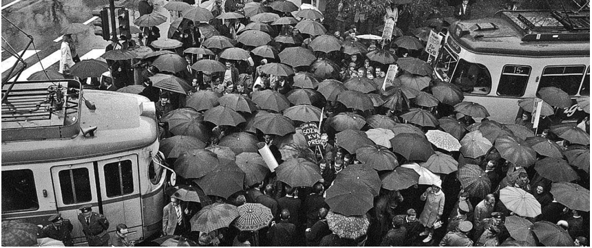
Abbildung 1: Sogenannte „Regenschirmdemo“ gegen KVB-Fahrpreiserhöhung 1966 in Köln 2