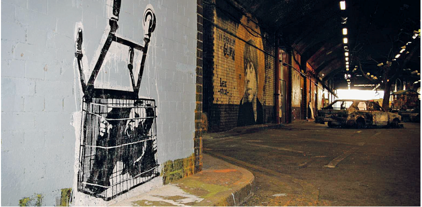
Abbildung 8: Banksy-Graffiti 49

In diesem Zusammenhang sei auch auf den Begriff der „strukturellen Gewalt“ von Johan Galtung verwiesen, 50 weil er beleuchtet, dass Teilhabe an dem, was ich Versorgungsregime nenne, mit anderen Worten Konsumchancen bzw. Zugang zu Infrastrukturen, ganz wichtige Parameter für Lebenschancen sind. Das schlägt sich zum Beispiel in Lebenserwartung nieder, aber auch in alltäglichen Möglichkeiten der Teilhabe an politischen, kulturellen und wirtschaftlichen Prozessen. Um dieser Einsicht gerecht zu werden, muss man nicht zwangsläufig besonders radikal sein, sondern man kann mit John Rawls und einer Theorie der Gerechtigkeit sagen, dass das Gemeinwesen die Ungleichheiten in Verteilung und Zugang sehen muss und dass es Aufgabe des Gemeinwesens ist, darüber nachzudenken, ob es nicht in seinem Interesse liegt, ausgleichend gegenzusteuern. Insofern sind Verbraucher, die sich als solche organisieren, natürlich eine Stimme in dem