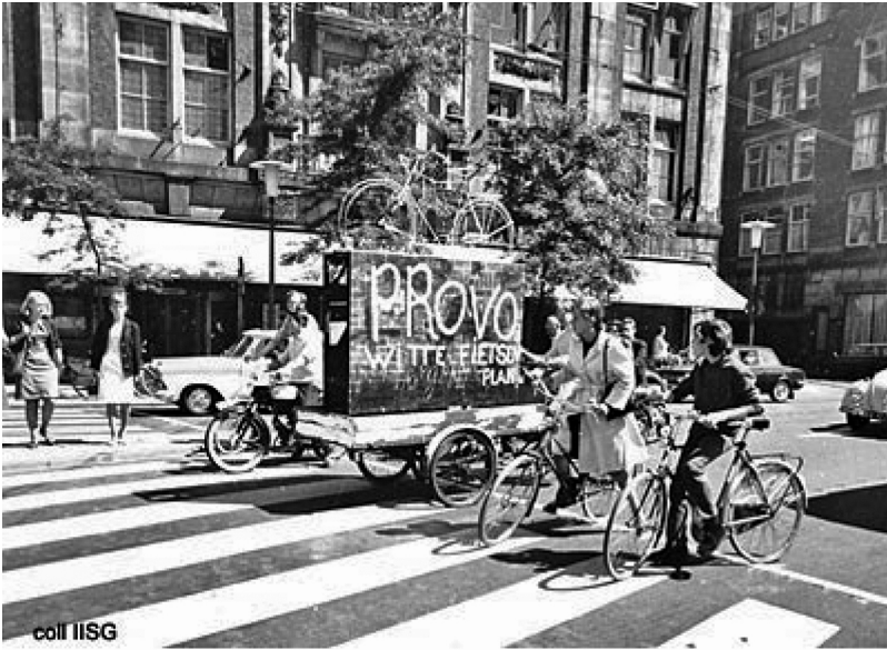
Abbildung 4: Provo, Weißer Fahrradplan, 1966 32

Damit antizipierten sie (politische) Ideen, die für uns heute selbstverständlich sind, denkt man an die Verkehrsberuhigung von Innenstädten oder die Bereitstellung kollektiv genutzter Fahrräder. Der Weiße Schornsteinplan sah die Besteuerung von Luftverschmutzung vor, der Weiße Wohnungsbauplan ein Verbot der Bauspekulation und die Förderung von Hausbesetzungen. Der Weiße Opferplan sollte jeden, der einen tödlichen Autounfall verur-