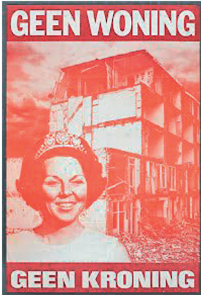
Abbildung 5: "Keine Wohnung, keine Krönung", 1980 38

Ein allgemein unterschätzter Aspekt der Geschichte von Hausbesetzerbewegungen bzw. – etwas theoretischer – des informellen Wohnens in den 1970er Jahren ist die Aneignung von Wohnraum als Selbsthilfe. Die Geschichte der Wohnungskämpfe in Ländern wie Italien oder Großbritannien bis hin zu Favelas im globalen Süden ist insofern lehrreich, als Konflikte auf allen Ebenen des „formal-informal housing continuum“ 39 ausgetragen