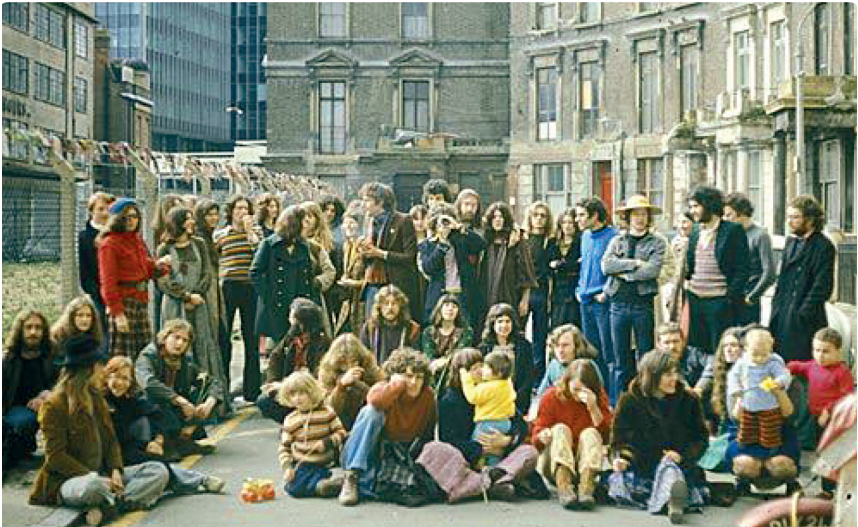
Abbildung 6: Hausbesetzer am Londoner Tolmers Square protestieren gegen bevorstehende Räumung, 1975 40

In Großbritannien wie anderswo war eine notwendige Voraussetzung für Hausbesetzungen die Existenz von ungenutztem Wohnraum. Vor allem, wenn sich leerstehende Wohnungen in öffentlichem Besitz befanden, wurden ihr physischer Schutz sowie die rechtliche, moralische und politische Rechtfertigung solcher Leerstände zu einem Problem für die Behörden, wie