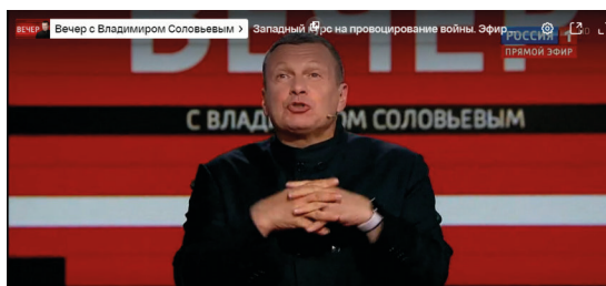
Abbildung 8: Der bekannte Moderator Wladimir Solowjow verböhnt die Energiesparmaßnahmen in Deutschland. Screenshot: Rossija 1 . 69

Im Herbst 2022 berichtete RT DE wohlwollend über die Demonstrationen gegen die Sanktionen und Regierung in zahlreichen Städten Deutschlands. Die Berichte hatten das Ziel, die Wut der Menschen auf die Sanktionen zu lenken und das politische System anzugreifen. Dabei wurde Russlands Rolle als Verursacher des Kriegs und Aggressor erneut ausgeblendet. „Ein System, das auf Angst basiert, ist zum Scheitern verurteilt“, titelte RT DE etwa und meinte damit das gesellschaftliche und politische Gefüge. Der gesellschaftliche Zusammenhalt und eben dieses System würden sich „weiter nach und nach in Luft auflösen“. Autor Tom Wellbrock führte aus: „Im Osten Deutschlands zeichnet sich etwas ab, das das Potential zu großem, flächendeckendem Widerstand hat.“ Er sah das „Ende einer Wohlstandsgesellschaft“ gekommen. Die Ursache dafür seien „fatale politische Entscheidungen“, womit er vor allem die „vermeintliche Solidarität mit der Ukraine“ meinte. 68