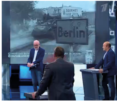
Abbildung 3: Die Erinnerung an den Sieg über die deutschen Faschisten im Zweiten Weltkrieg ist im russischen Fernsehen allgegenwärtig. 33

Die Erinnerung an den Zweiten Weltkrieg soll zum erneuten Kampf mobilisieren, dient aber auch dazu, Russland als erneutes Opfer des Faschismus zu präsentieren. In der Talk Show „Wremja Wspomnit“ (Zeit sich zu erinnern) beim Perwyj Kanal , dem größten TV-Sender Russlands, zeigte Moderator Aleksandr Gordon ein Video über die Siegesfeier im besiegten Berlin von 1945. „Es schien, dass sie es nie vergessen werden“, sagt er, aber dann präsentiert er die Reaktionen Lettlands auf den Krieg in der Ukraine wie die Einordnung Russlands als „Staat, der Terror unterstützt“. 34 Auch Beschränkungen Lettlands für die Einreise von russischen Staatsbürgern und den Gebrauch der russischen Sprache werden diskutiert. Gordon sieht die Russen als Opfer eines neuen Faschismus, wenn er fragt: „Im 21. Jahrhundert haben die Russen die Rolle der Juden übernommen, ist es so oder nicht?“ Im Verlauf der Sendung gibt Gordon selbst die Antwort: „Was hat sich geändert in dem Bewusstsein der Letten, die jetzt nach ethnischen Kriterien de facto eine Form des Genozids vollziehen?“ 35