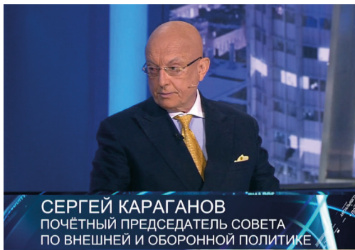
Abbildung 7: Außenpolitiker Karaganov sieht China und Russland als Gewinner des globalen Machtkampfes. 58

Seite Chinas als zukünftigen Gewinner dieses Kampfes sieht. „Zwischen Russland und China besteht de facto ein strategisches Bündnis. Es ist gut, dass wir zusammen sind, das schwächt ihre Kräfte [...], Amerika wird zweifellos eine große Niederlage in so einem Krieg an zwei Fronten (gemeint sind Russland und China, Anm. d. Autorin) erleiden“, sagte Karaganow in der Talk Show „Prawo snat“ des Senders TV Zentr. 56 Europa sei für Russland nicht mehr interessant, so Karaganow: „Europa hat seine Rolle als Quelle der Modernisierung verloren, die es fast 300 Jahre gespielt hat. [...] Intellektuell und wirtschaftlich sollten wir vom Eurozentrismus loskommen.“ Karaganow sieht die Zukunft Russlands im Osten: „Wir sind Eurasier [...] wir kehren nach Hause zurück.“ 57