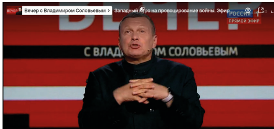
Abbildung 8: Der bekannte Moderator Wladimir Solowjow verböhnt die Energiesparmaßnahmen in Deutschland. 69

Im Herbst 2022 berichtete RT DE wohlwollend über die Demonstrationen gegen die Sanktionen und Regierung in zahlreichen Städten Deutschlands. Die Berichte hatten das Ziel, die Wut der Menschen auf die Sanktionen zu lenken und das politische System anzugreifen. Dabei wurde Russlands Rolle als Verursacher des Kriegs und Aggressor erneut ausgeblendet. „Ein System, das auf Angst basiert, ist zum Scheitern verurteilt“, titelte RT DE etwa und meinte damit das gesellschaftliche und politische Gefüge. Der gesellschaftliche Zusammenhalt und eben dieses System würden sich „weiter nach und nach in Luft auflösen“. Autor Tom Wellbrock führte aus: „Im Osten Deutschlands zeichnet sich etwas ab, das das Potential zu großem, flächendeckendem Widerstand hat.“ Er sah das „Ende einer Wohlstandsgesellschaft“ gekommen. Die Ursache dafür seien „fatale politische Entscheidungen“, womit er vor allem die „vermeintliche Solidarität mit der Ukraine“ meinte. 68