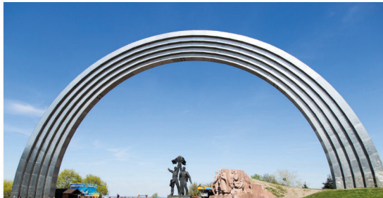
Abbildung 4: In den Berichten von RT DE wird behauptet, dass Russen und Ukrainer ein Volk seien. 36

Während von ukrainischer Seite die Abgrenzungsbemühungen vom allem Russischen seit 2014 immer heftiger wurden, versucht Moskau bis heute, die ethnische Ebene aus dem Konflikt herauszuhalten. Eine neue Publikation widmet sich nun dem vermeintlichen Gegensatz zwischen Ukrainern und Russen.