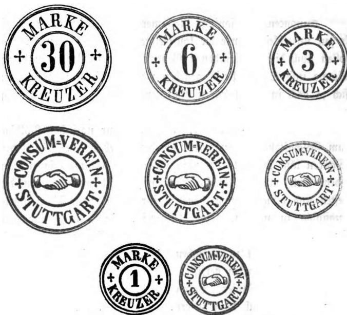
Abbildung 18: Stuttgarter Marken als Vorlage für Konsummarken (Pfeiffer, 1865, S. 116)

Das Kreditmarkensystem hatte noch zusätzliche Vorteile: Durch den Vorabkauf des Konsumgeldes erhielt die Genossenschaft ein beträchtliches Kapital in konventioneller Wahrung von ihren Mitgliedern zinslos zur Verfugung gestellt. Heute wurde man das als „Prepaid“ bezeichnen. Auerdem konnten die Umsatze der Mitglieder auch mit dem assoziierten Gewerbe sehr einfach festgestellt werden. Die Konsumgenossenschaft konnte damit auch Waren gunstiger abgeben, die sie nicht selbst einkaufen und verkaufen musste. Dazu wurden sogenannte Markenvertrage mit den Lieferanten der benotigten Waren abgeschlossen. Diese verpflichteten sich, die Marken von Mitgliedern der Genossenschaft 1:1 anstelle der Landeswahrung anzunehmen. Sie konnten dieses anschlieend bei der Zahlstelle der Genossenschaft gegen einen vereinbarten Abschlag wieder in courantes Geld einlosen. Der Vorteil fur diese Geschaftspartner lag in der damit verbunde-