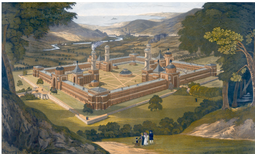
Abbildung 17: Owens Vorstellung von New Harmony, Indiana (Bild von F. Bates 129 )

Die „utopische Periode“ war jedoch noch nicht zu Ende. Theodor Hertzka 1889 erschienener Roman „Freiland“ beschreibt ein mit detaillierten ökonomischen Überlegungen versehenes „soziales Zukunftsbild“ in Ostafrika, im heutigen Kenia. Das Siedlungsvorhaben mit vielen tausend Menschen gipfelt aber eigentlich in einer Staatsgründung eines hochtechnisierten neuen Typus. Das Buch fand großen Zuspruch, und bald bildeten sich in mehreren Ländern „Freiland-Vereine“, die ein solches Projekt umsetzen wollten. Ein Umsetzungsversuch 1894 am Originalschauplatz in Kenia scheiterte allerdings bereits an der Kapitalbeschaffung und an der fehlenden Bereitschaft der Britischen Kolonialbehörde. (Amann/von Neumann, 1995, S. 16) Hertzka brachte damit aber wieder neuen Schwung in die Siedlungsgenossenschaftsidee. Auch anderenorts wurden exotische Siedlungsprojekte angegangen. Ein Namensvetter von Robert Owen, Albert Kimsey Owen, hatte z.B. hochfliegende Pläne von einer Musterstadt, die er in Topolobambo, Mexiko, umsetzen wollte, die aber nach einigen Jahren ebenfalls scheiterten (Katscher, 1922). 130