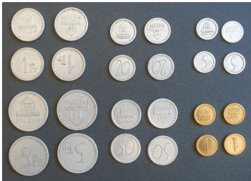
Abbildung 19: Die Münzen des Freidorfgeldes aus Aluminium und Messing

der gemachten Ausführungen an der Generalversammlung zu referieren.“ 187 (SGF SdV 1920/26) Die am Nachmittag des gleichen Tages stattfindende Generalversammlung hatte dann diese Mitteilung scheinbar ohne Diskussion entgegengenommen, sodass an der darauffolgenden 27. Sitzung des Verwaltungsrats vom 29.06.1920 der endgültige Beschluss gefasst werden konnte: „Ausgabe von Konsumgeld. Der Verwaltungsrat beschließt, Konsumgeld aus Aluminium anfertigen zu lassen und zwar je 3000 Stück von folgenden Sorten: 5 cts., 20 cts., 50 cts., 1 Fr., 5 Fr. Architekt Meyer wird ersucht, eine Zeichnung der Marken zu machen.“ Im Wochenblatt wurde dann dieser Entscheid mit folgenden Zeilen „beworben; „Die Münzen werden die Taschen unserer Hausfrauen nicht schwer belasten, denn sie sind aus Aluminium. Es können also ohne grosse Gefahr, sich zu überlupfen, grosse Summen auf einmal eingetauscht werden, gegen schnöde gewöhnliche Silberlinge und Nationalbankpapier.“ (SGF Wochenblatt 27/1920)