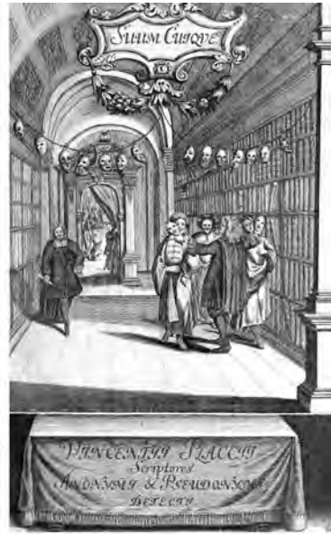
Abbildung 5: Titelei von Placcius' Theatrum Anonymorum 1708.

gitimen Ordnung herrscht Karneval, Intrige und Unauthentisches: in der Bibliothek dagegen das organisierte legitime Wissen. »Theatrum« meint ja nicht nur das Schauspiel, sondern die Organisation von Wissen schlechthin. 331 Damit lässt sich das Genre der Demaskierungsliteratur, getragen von kollektiven Strategien der Citoyens der »Gelehrtenrepublik«, auch als Ausdruck einer ganzen Konstellation begreifen, die Identität und Identifizierbarkeit neu denkt. Placcius' Unterfangen stellt den Höhepunkt dieser ersten Inszenierung von anonymen Schriften, ja des Spiels um Anonymisierung dar. Auf jeden Fall stellt es ein stilbildendes Werk der Problematisierung und paradigmatischer Subsumierung von Texten unter der Kategorie anonymer Werke dar.