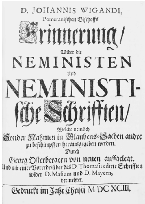
Abbildung 2: Die mutmaßlich erste systematische Attacke auf unbekannte Verfasser: Wigands 1693 erschienene Schrift Wider die Neministen . Lateinische Erstfassung 1576.

Schriften folgten nicht der neuen, von der (katholischen) Zensur eingeführten Regel der Nennung der Verfasserschaft, sondern verweigerten sie oder spielten mit ihr. Was Wigands Kampfschrift bemerkenswert macht, ist die Tatsache, dass er die verfassunglosen Schriften nicht einfach markierte wie Gessner, sondern ihr Zustandekommen erforschte. Er wollte mit der Denunziation ihrer Verfasser auch eine Hypothese zu ihrer Herkunft und zu ihren Motiven liefern. Dazu diente ihm ein gleichsam naturwissenschaftlicher Blick auf die Texte, der den moralischen Bannstrahl erst legitimieren sollte. Wigand fühlte sich einem ähnlichen strengen Empirismus und naturwissenschaftlichen verpflichtet wie Gessner. Selbst betätigte er sich zugleich als Naturforscher, lehrte Physik, 204 er legte Beschreibungen und Klassifikationen der Pflanzen seiner Umgebung an. Er gilt heute als »Preußens erster Botaniker«, der ein umfassendes Werk vorlegte. 205 Der Schwerpunkt seines Schaffens lag indes auf theologischem Gebiet.