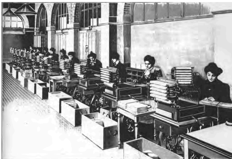
Abbildung 35: Depersonalisierung durch Klassifizierung: Les dames de la Statistique Générale de la France.