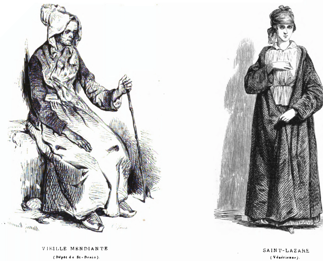
Abbildung 39: Nur Typen ohne Namen: Darstellung einer Bettlerin (links) und einer inhaftierten Prostituierten (rechts).

Der Beitrag enthielt auch Darstellungen der Betroffenen, die jedoch von anderer Art waren als die Abbildungen der gewöhnlichen Physiologien. Es handelte sich nicht mehr um Karikaturen, sondern um fein gezeichnete Porträts, also um Darstellungen von Menschen aber nicht zum Zweck der Identifikation einer Person oder des karikierenden Schilderns. Die Funktion lag auch nicht in der künstlerischen Darstellung, die sich als Form selbst genügte. Es sollte mittels eines wirklichen oder imaginierten Bildes vielmehr ein Verständnis der elenden Situation von Menschen geschaffen werden. Exemplarisch hierfür sind die Visualisierung einer Bett-