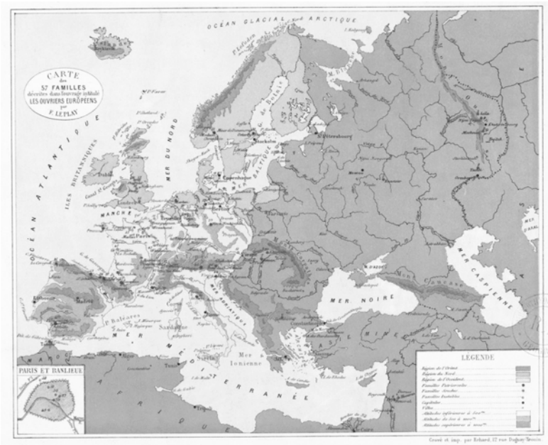
Abbildung 41: Le Plays Markierung des sozialen Raumes. Carte des 57 Familles décrites dans l'ouvrage les Ouvriers Français 1879.

dagegen definiere sich nur durch die Eltern, löse sich bei deren Tod auf und sei deshalb die am wenigsten stabile soziale Einheit, während die anderen beiden Typen immer noch eine strikte Nachfolgeregelung kannten. 243 Ein Zusammenhang mit der geografischen Konstellation lässt sich insofern erkennen, als in Skandinavien die grünen Punkte überwiegen, und in Frankreich rote (instabile Familien). Le Play hatte den sozialen Raum nach verschiedenen Graden der Stabilität markiert, wobei Frankreich gemäß seiner Kategorisierung die instabilste Gesellschaft darstellte. War hier ein neues Wissenssystem gefunden, das die Mängel vorhergehender überwand?