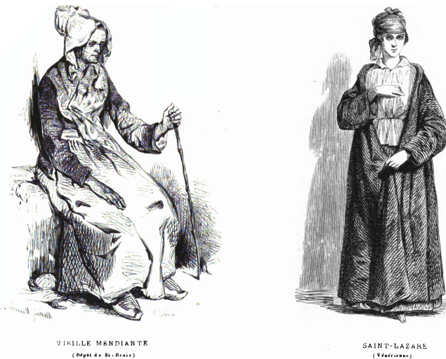
Abbildung 39: Nur Typen ohne Namen: Darstellung einer Bettlerin (links) und einer inhaftierten Prostituierten (rechts).

Der Beitrag enthielt auch Darstellungen der Betroffenen, die jedoch von anderer Art waren als die Abbildungen der gewöhnlichen Physiologien. Es handelte sich nicht mehr um Karikaturen, sondern um fein gezeichnete Porträts, also um Darstellungen von Menschen aber nicht zum Zweck der Identifikation einer Person oder des karikierenden Schilderns. Die Funktion lag auch nicht in der künstlerischen Darstellung, die sich als Form selbst genügte. Es sollte mittels eines wirklichen oder imaginierten Bildes vielmehr ein Verständnis der elenden Situation von Menschen geschaffen werden. Exemplarisch hierfür sind die Visualisierung einer Bett-