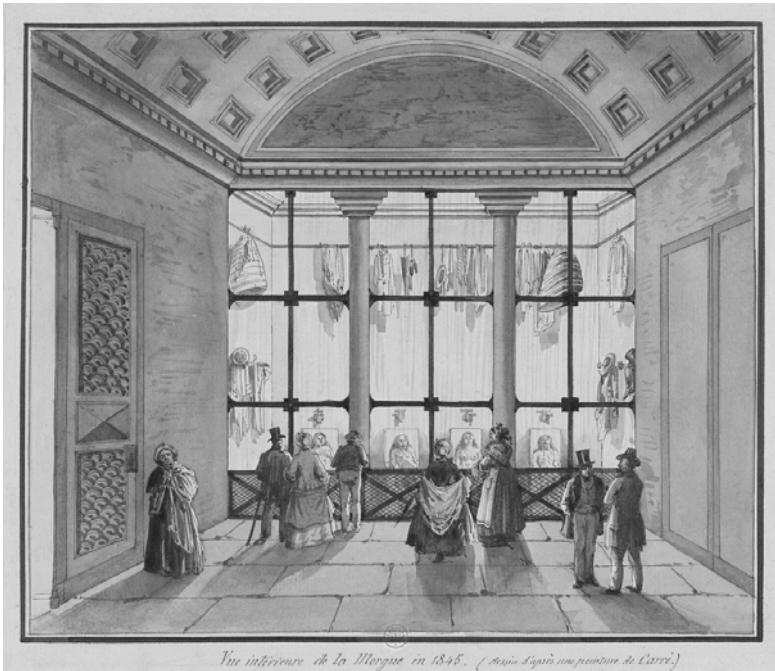
Abbildung 44: Identifikation namenloser Toter: Innenansicht der Morgue 1845.

Weise weiter ausgewertet und repliziert. 341 Wie Mitchell feststellt, wurde hierfür das erste Mal auch die soziale Integration als Faktor des Elends erkannt, die Durkheim später dann als zentrales Moment in seine Soziologie aufnehmen sollte. 342 Die Untersuchung der Gründe dafür legen nahe, dass dieses Dispositiv nicht nur der Wiederherstellung der Ordnung der Namen und der Individuen diene, sondern dass es auch darum ging, die zuvor unbekanntenen Toten mit einem Erklärungsmuster für die Todesursache zu versehen, was den Todesfall wiederum begreifbar machte. Die Wissenschaft sollte sich gegen die wuchernden Erzählungen positionieren, die über die Vorfälle unweigerlich ins Kraut schossen: »Notre but est tout différent, nous faisons une œuvre sentimentalement scientifique«, schrieb Gavinzel in seiner Studie zur Morgue. 343 Die Morgue war auch ein Tempel sozialer Fiktionen, und die Wissenschaft sollte sie kontrollieren.