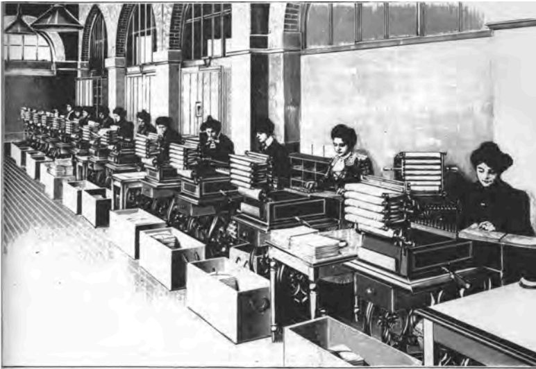
Abbildung 35: Depersonalisierung durch Klassifizierung: Les dames de la Statistique Générale de la France.

Quelle: Institut Nationale de la Statistique et des Études Économiques 1987, S. 5.