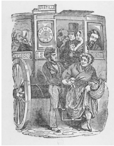
Abbildung 37: Physiologie de l'omnibus : Eine Stichprobe der Gesellschaft.

katur (vgl. die Abbildung 37) und viele Dialoge. 142 Der Herausgeber der Reihe sagt, dass das Büchlein leichtfüßig geschrieben sei und mit Freuden gelesen werden könne. Es habe sich gezeigt, dass die Integration von Bildern gefiele, weshalb auch diese Physiologie illustriert sei. 143 Es ließe sich an allen Bureau d'Omnibus erstehen. Was aber wird beschrieben? Es geht nicht um Einzelphänomene, sondern um eine Beschreibung der Gesellschaft selbst, wie etwa in dem Abschnitt L'omnibus et la société kenntlich wird: