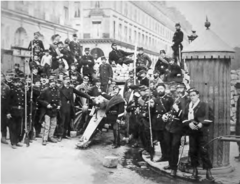
Abbildung 36: »Eine Manie sich selbst zu fotografieren«: Selbst-Portraitierung während der Zeit der Commune de Paris (1871).

greifen, als eine Art »Entbettung« (»disembedding«), wie es Anthony Giddens nennt. 56 Es entstanden neue Möglichkeiten der Zirkulation der Individuen wie auch ihrer Dinge, sowohl geografisch wie sozial, und es ergaben sich neue Herausforderungen an die symbolische Erfassung und Registrierung der Individuen.