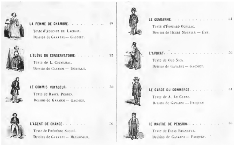
Abbildung 40: Die Visualisierung einer Typologie: Auszug aus dem Inhaltsverzeichnis von Les Français peints par eux-mêmes .

sellschaft von Formen repräsentierend, die jedoch den Anspruch hatten, sich in der konkret wahrnehmbaren Wirklichkeit der Individuen zu begründen – deshalb auch die hohe Konzentration auf die sichtbare Welt, deshalb auch die Assemblage von Figur und Diskurs, die die Physiologien auszeichneten. Und vor allem, diese neuen Einzelwesen der Typen brauchten Namen: Die Physiologien bereiteten dadurch einer neuen Form von Nomenklaturen und Codierungen des Sozialen das Terrain.