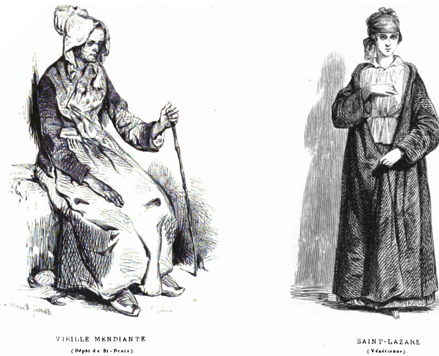
Abbildung 39: Nur Typen ohne Namen: Darstellung einer Bettlerin (links) und einer inhaftierten Prostituierten (rechts).

Der Beitrag enthielt auch Darstellungen der Betroffenen, die jedoch von anderer Art waren als die Abbildungen der gewöhnlichen Physiologien. Es handelte sich nicht mehr um Karikaturen, sondern um fein gezeichnete Porträts, also um Darstellungen von Menschen aber nicht zum Zweck der Identifikation einer Person oder des karikierenden Schilderns. Die Funktion lag auch nicht in der künstlerischen Darstellung, die sich als Form selbst genügte. Es sollte mittels eines wirklichen oder imaginierten Bildes vielmehr ein Verständnis der elenden Situation von Menschen geschaffen werden. Exemplarisch hierfür sind die Visualisierung einer Bett-