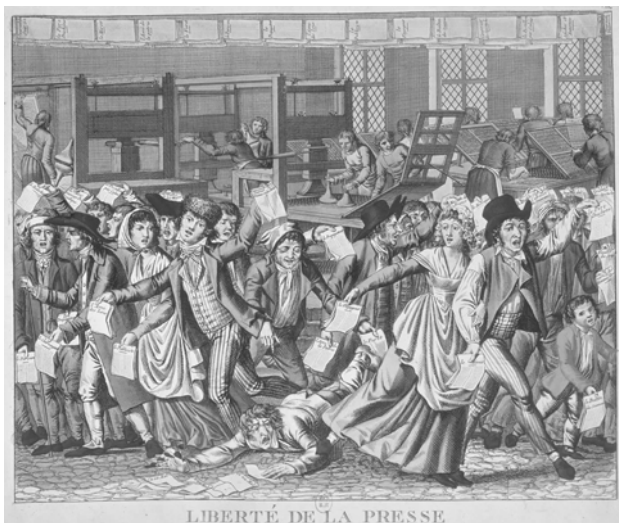
Abbildung 7: Liberté de la Presse (ohne Urheber, ohne Jahr).

Die Verrechtlichung des Anonymen, die Fabrikation eines Begriffs mit klarem Bedeutungshorizont reagierten auf eine veränderte politisch-soziale Konstellation: auf das Entstehen einer Zirkulations- und Rezeptionssphäre, die den Namen »Öffentlichkeit« erhielt und der Selbstkonstitution der Bevölkerung als politische Einheit dienen sollte. 1 Dieser Zusammenhang wird allerdings erst deutlich, wenn »Öffentlichkeit« nicht nur als Ort von einsehbarer politischer Debatten und Argumenten begriffen wird, sondern zugleich als eine normative Institution, die von dem zehrt, was den eigenen Kriterien entgeht. Das Entstehen von Öffentlichkeiten, so sieht es Habermas in seiner klassischen Studie zum »Strukturwandel der Öffentlichkeit«, ist getragen von einem neuen Ideal, nämlich, der »Subjektivität und Selbstverwirklichung«, der »rationale[n] Meinungs- und Willensbildung«, wodurch auch neue Realitäten wie die Pressefreiheit entstehen. 2 Doch was eine normative Perspektive auf der Suche nach dem Kontrafaktischen ausblendet: Es entfaltet sich zugleich auch eine anarchische Sphäre der Zirkulation von Wissen, Texten, Erzählungen, die diese Ideale eigent-