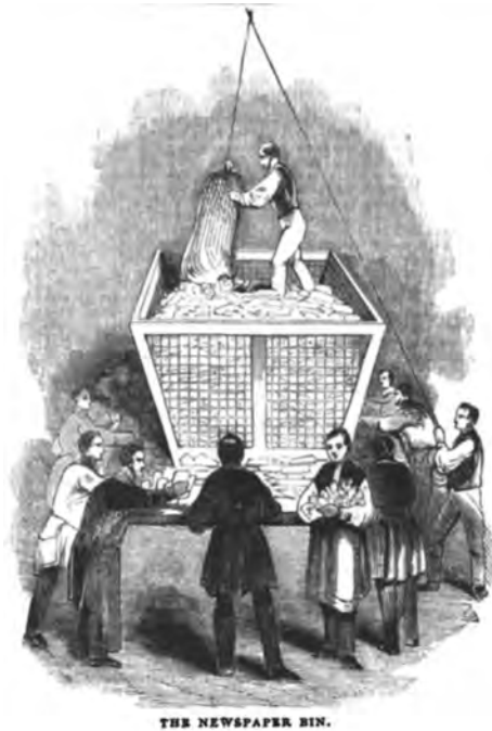
Abbildung 11: Die Abfertigung von Zeitungen.