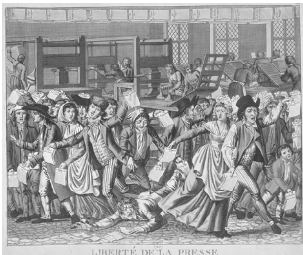
Abbildung 7: Liberté de la Presse (ohne Urheber, ohne Jahr).

Die Verrechtlichung des Anonymen, die Fabrikation eines Begriffs mit klarem Bedeutungshorizont reagierten auf eine veränderte politisch-soziale Konstellation: auf das Entstehen einer Zirkulations- und Rezeptionssphäre, die den Namen »Öffentlichkeit« erhielt und der Selbstkonstitution der Bevölkerung als politische Einheit dienen sollte. 1 Dieser Zusammenhang wird allerdings erst deutlich, wenn »Öffentlichkeit« nicht nur als Ort von einsehbarer politischer Debatten und Argumenten begriffen wird, sondern zugleich als eine normative Institution, die von dem zehrt, was den eigenen Kriterien entgeht. Das Entstehen von Öffentlichkeiten, so sieht es Habermas in seiner klassischen Studie zum »Strukturwandel der Öffentlichkeit«, ist getragen von einem neuen Ideal, nämlich, der »Subjektivität und Selbstverwirklichung«, der »rationale[n] Meinungs- und Willensbildung«, wodurch auch neue Realitäten wie die Pressefreiheit entstehen. 2 Doch was eine normative Perspektive auf der Suche nach dem Kontrafaktischen ausblendet: Es entfaltet sich zugleich auch eine anarchische Sphäre der Zirkulation von Wissen, Texten, Erzählungen, die diese Ideale eigent-