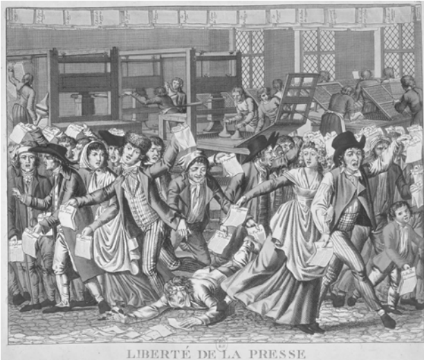
Abbildung 7: Liberté de la Presse (ohne Urheber, ohne Jahr).

Die Verrechtlichung des Anonymen, die Fabrikation eines Begriffs mit klarem Bedeutungshorizont reagierten auf eine veränderte politisch-soziale Konstellation: auf das Entstehen einer Zirkulations- und Rezeptionssphäre, die den Namen »Öffentlichkeit« erhielt und der Selbstkonstitution der Bevölkerung als politische Einheit dienen sollte. 1 Dieser Zusammenhang wird allerdings erst deutlich, wenn »Öffentlichkeit« nicht nur als Ort von einsehbaren politischen Debatten und Argumenten begriffen wird, sondern zugleich als eine normative Institution, die von dem zehrt, was den eigenen Kriterien entgeht. Das Entstehen von Öffentlichkeiten, so sieht es Habermas in seiner klassischen Studie zum »Strukturwandel der Öffentlichkeit«, ist getragen von einem neuen Ideal, nämlich, der »Subjektivität und Selbstverwirklichung«, der »rationale[n] Meinungs- und Willensbildung«, wodurch auch neue Realitäten wie die Pressefreiheit entstehen. 2 Doch was eine normative Perspektive auf der Suche nach dem Kontrafaktischen ausblendet: Es entfaltet sich zugleich auch eine anarchische Sphäre der Zirkulation von Wissen, Texten, Erzählungen, die diese Ideale eigent-