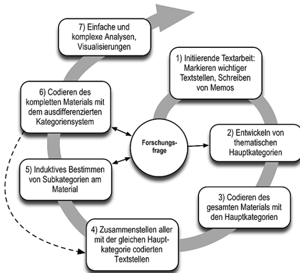
Abbildung 52. Ablauf einer inhaltlich strukturierenden qualitativen Inhaltsanalyse (Kuckartz, 2018, S. 100).

Kuckartz geht beim Ablauf der inhaltlich strukturierenden qualitativen Inhaltsanalyse, die bei Mayring eher kurz skizziert wird, von sieben Phasen aus, die auch in dieser Arbeit umgesetzt werden (Abbildung 52). Bei diesem mehrphasigen Vorgehen stehen die Forschungsfragen immer im Zentrum, egal ob es um die Exploration, Codierung oder Auswertung der Daten geht. Nach der Exploration des Materials in Phase 1, werden in Phase 2 die thematischen Hauptkategorien bestimmt. Da die Aussagen der Interviewpartner verglichen werden, sind die Aspekte beziehungsweise Fragen des Leitfadens als Hauptkategorien anzulegen. So wird zum Beispiel aus der Frage, ob bei der Musikplanung die Beats per Minute der Songs eine Rolle spielen, die Kategorie „BPM bewusst geplant“. In Phase 3 wird das gesamte Material codiert und den Hauptkategorien zugeordnet. Dabei werden im ersten Schritt die Antworten der Interviewpartner den Hauptkategorien (Analyseeinheiten) zugeordnet, die den Fragen des Leitfadens entsprechen. Als kleinste Codiereinheit dient mindestens ein ganzer Satz. Außerdem wird so viel codiert, wie zum Verständnis einer Aussage nötig ist. Es werden also Kontexteinheiten gebildet. Aussagen, die